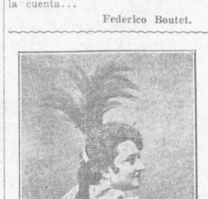
MODELO DE CAPA, SALIDA DE TEATRO. A Menéndez Pelayo Era la Patria

que soy su hijo. Mi madre siguió en el negocio después de ocurrida la desgracia y a su muerte me encargó yo.