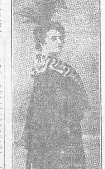
OTRO MODELO DE CAPA, SALIDA DE TEATRO.

Quien dijere hospital, teracana, cementerio, intrépete y catedral, ganará un lote compuesto de una albarda y un bozal.