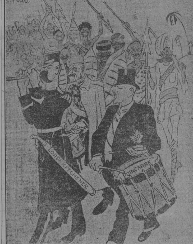
EL ULTIMO CONTINGENTE DE LA CULTURA.—(Caricatura publicada en un periódico alemán).

Madrid, 19. La prensa publica importantes declaraciones del ilustre orador tradicionalista, señor Vázquez de Mella, sobre la neutralidad de España. Ha dicho el señor Mella que la actitud de Portugal, por un lado, y determinadas presiones que se hacen sobre España harán que su neutralidad corra grave riesgo de ser rota. Termina sus declaraciones el diputado tradicionalista diciendo que si España dejara de ser neutral, los tradicionalistas intervendrían en el asunto tomando medidas de gran trascendencia histórica. También estas declaraciones están siendo muy comentadas.