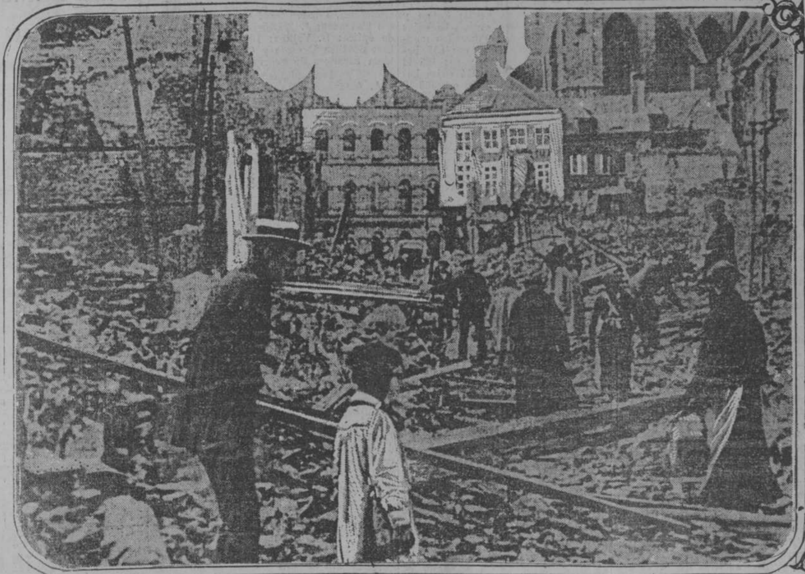
SOBRE LAS RUINAS DE SUS HOGARES.—Las comisiones nombradas al efecto han declarado terminantemente, que la destrucción de Lovaina fué por parte de los alemanes un acto injustificado; que todo obedece a las órdenes de algunos oficiales prusianos.

Comentando esta noticia, uno de los Almirantes ingleses más famosos