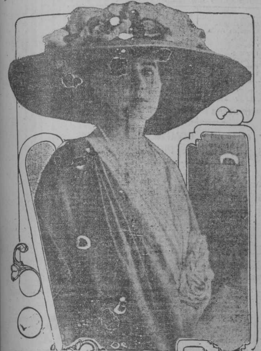
LA NUEVA REINA DE RUMANIA.—He aquí uno de los mejores retratos que se han publicado de la esposa del nuevo Rey Fernando de Bulgaria, que acaba de ocupar el trono por fallecimiento de su padre, el Rey Carlos, muerto recientemente. Tanto el nuevo Rey como su esposa son partidarios decididos de Francia.

El Ministerio de Marina dice que las pérdidas de vidas por el hundimiento del crucero "Takachioh" fueron las de 271 hombres. Pasa a la última plana