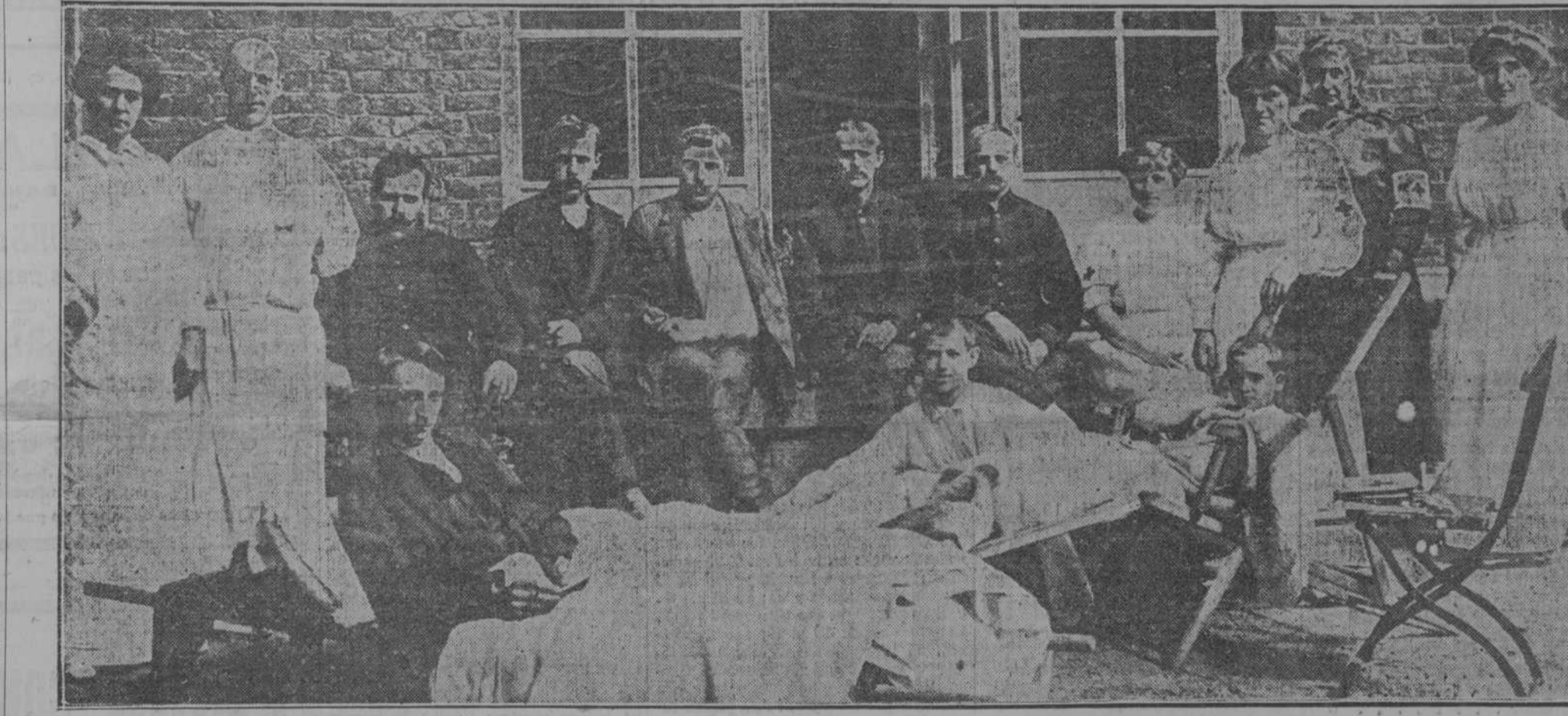
NIÑOS BELGAS VICTIMAS DE LA GUERRA, CONVALECIENDO EN EL HOSPITAL DE MAESTRICHT

NOTICIA CONFIRMADA Londres, 28. Se confirma la noticia de que han ocurrido recientemente violentos combates entre belgas y alemanes, y de que en Hotsede se atacó en el cielo a la artillería gruesa alemana, por lo que tuvieron que retirarse los alemanes. También se confirma la noticia de que los alemanes están fortificando a Lieja.