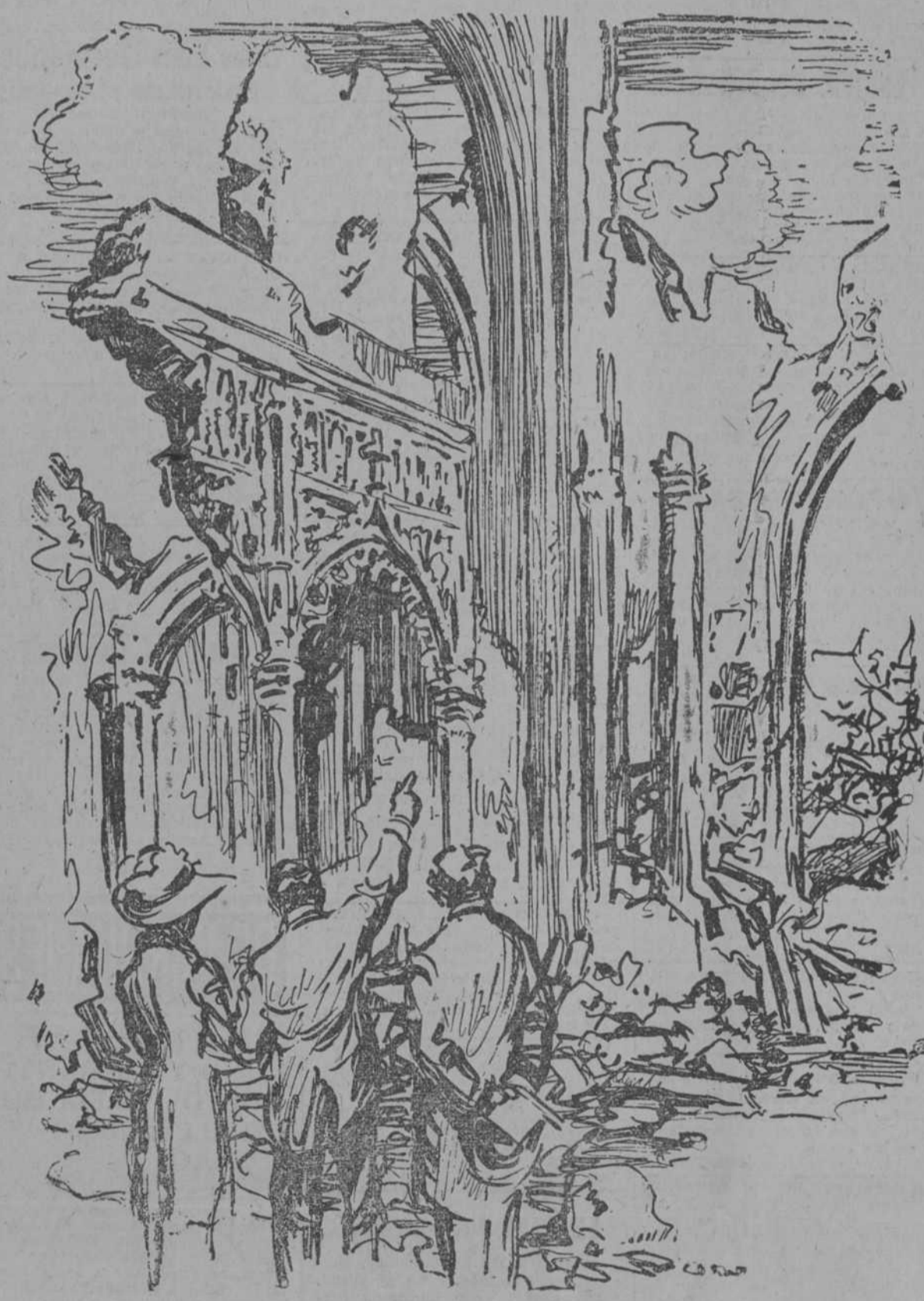
EL GUIA DE MAÑANA: ESTAS SON LAS RUINAS DE GUILLERMO II

Barritz, 25. El rey Alfonso XIII ha telegrafiado