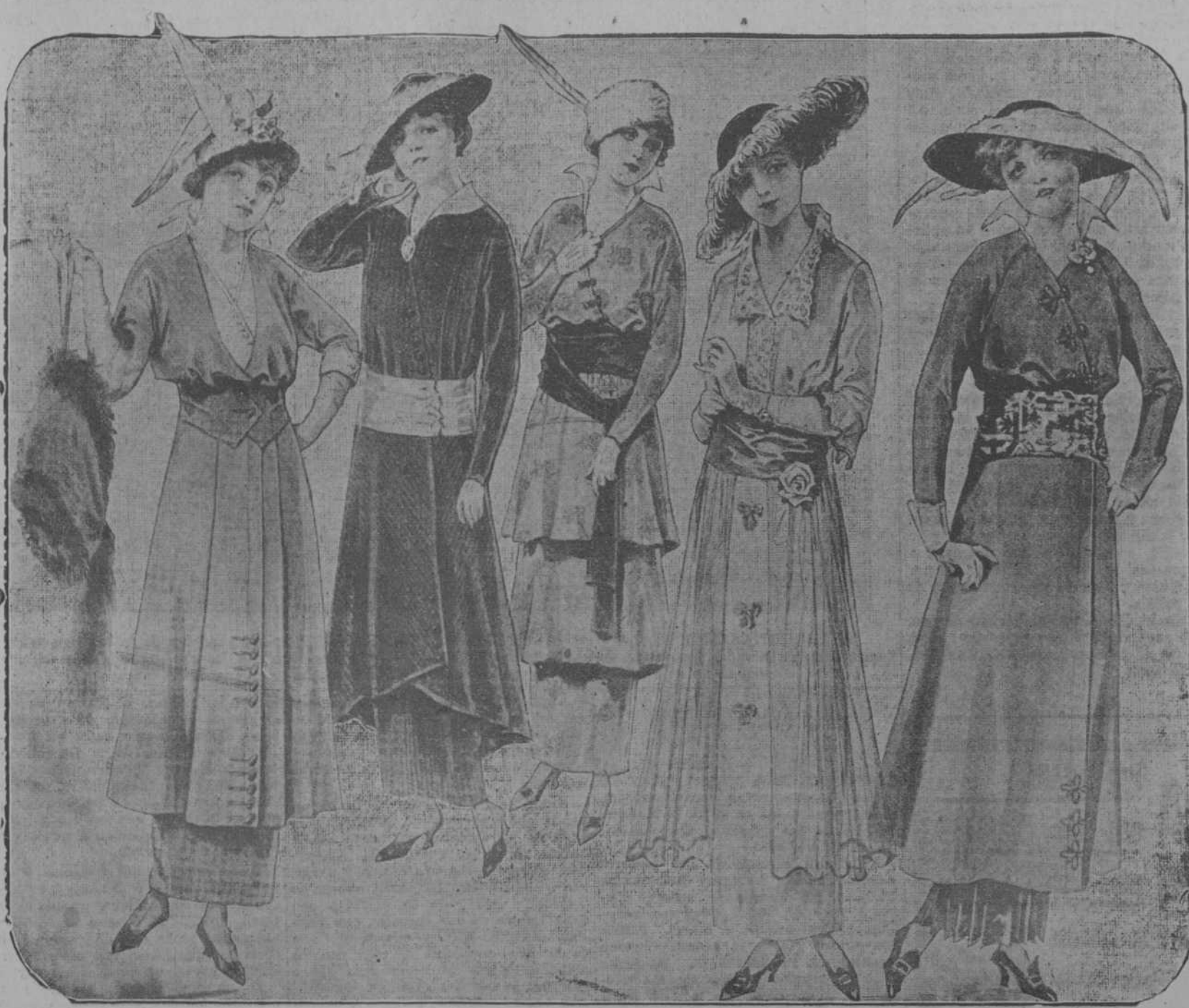
ELEGANTES TRAJES. - ULTIMOS MODELOS.