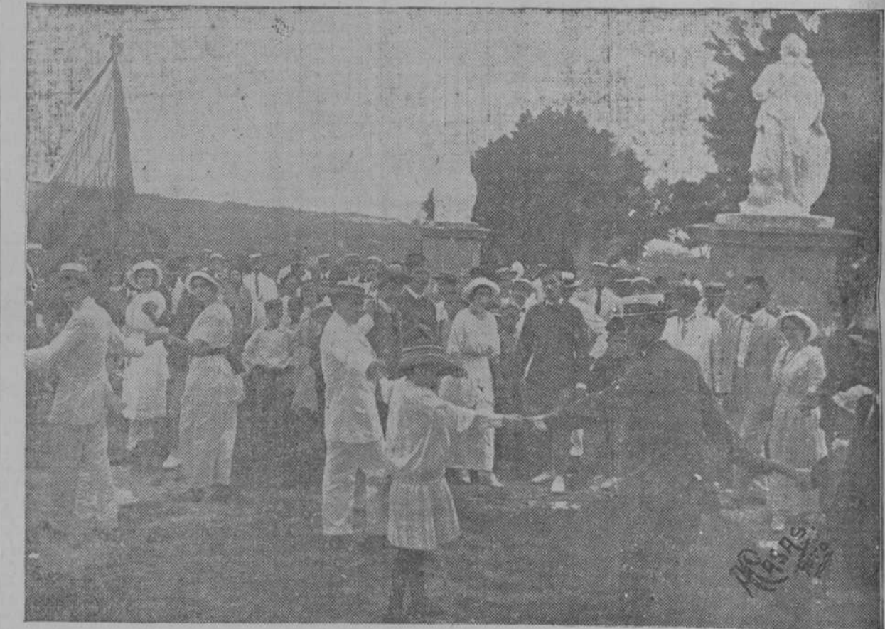
EN MATANZAS.—Bailando sardanas frente a la ermita de Monts "Colla."

Y la panacea no es otra cosa que la propia satisfacción espiritual, adquirida serenamente en las fuentes del bien y en el libro magno de la vida, con las ventanas del alma abiertas a todos los efluvios del misterio y accesibles a la comprensión metafísica de los fenómenos que nos rodean. Esa lumbre interior que engendra