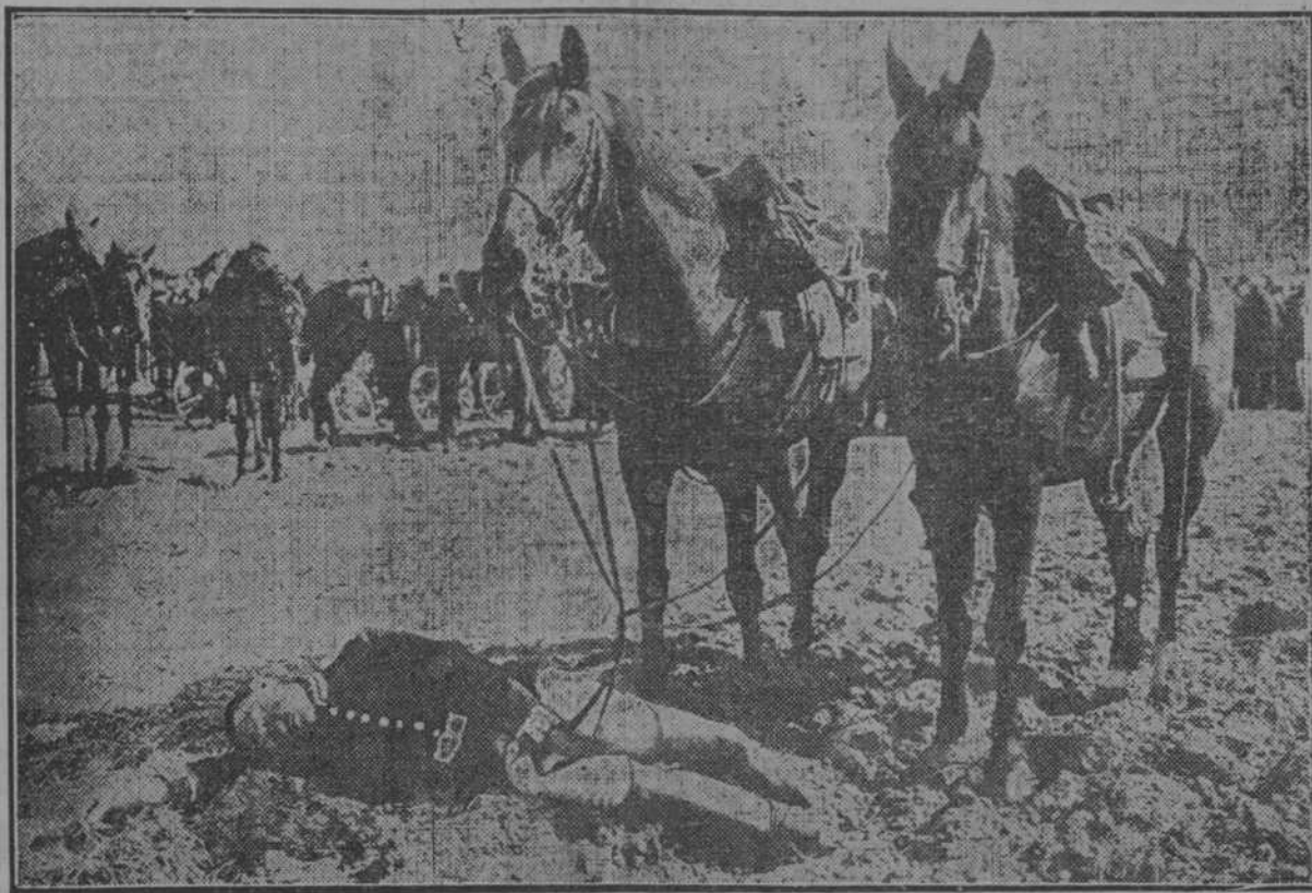
Un soldado de caballería alemana, cansado, disfrutando de unos momentos de sueño a la sombra de su caballo.

Otra versión sobre el mismo asunto asegura que Enver Pasha murió de resultas de las heridas que recibió en un duelo con el príncipe heredero de Turquía.