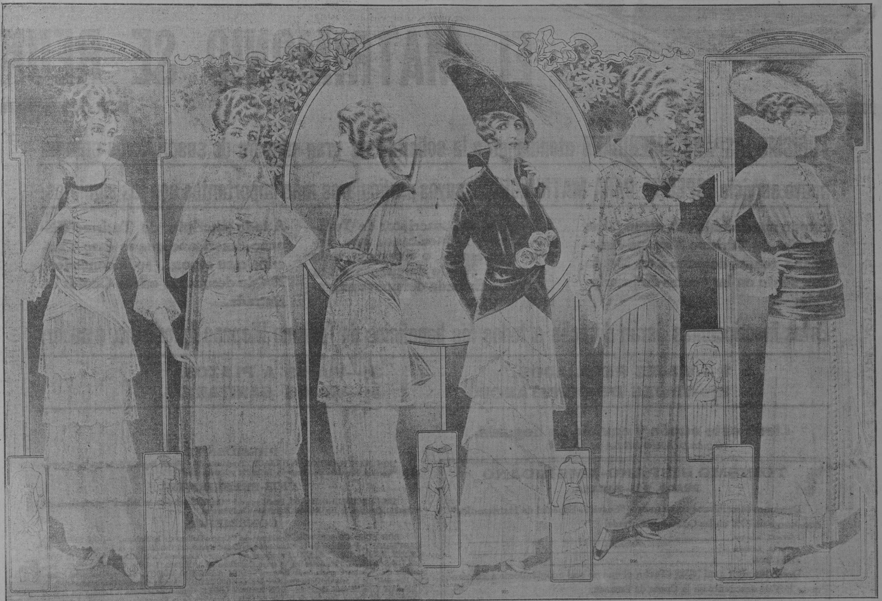
TEATRO BODA TARDE MASANA CASA CALLE

FOLLETIN 21 HENRY BORDEAUX NIEVE SOBRE LAS HUELLAS De venta en la Librería Cervantes Galiano número 62. Calló, aliviando y casi espantando de su propia súplica. Cumplida su tarea, no deseaba sino volver a su obscuridad habitual. Hecho para las expediciones de auxilio y de salvamento, aquel hombre sencillo, que ningún riesgo había detenido jamás en la montaña, experimentaba un gran terror en presencia de los dramas psicológicos y acababa de desplegar mayor firmeza y valor en aquella entrevista que en los despenaderos moledos del monte Velán. Pedía al prior permiso para retirarse, y a punto ya de traspasar la puerta, se dirigió Marcos a él. —Padre mío, le digo, permítame usted estrecharle la mano. —¡Oh! con mucho gusto, señor. —A usted, padre, le soy deudor de la vida. —Desde que pudo hablar, empezó a llamarle a usted. Y tan pronto como se retiró el padre Somnier, el prior, a solas con Marcos, se limitó a repetir: