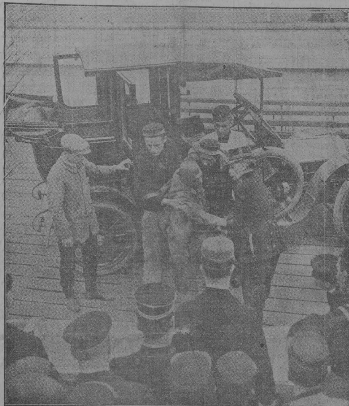
Las atenciones de los belgas con los enemigos heridos. Un alemán herido, trasladado por los belgas en automóvil, para su asistencia a un hospital de Ostende.

Londres, 10. Una comunicación oficial da cuenta de una victoria inglesa sobre los invasores alemanes en el Africa Central inglesa, y también de una reñida batalla en Komerún, Colonia occidental en el Oeste de Africa.