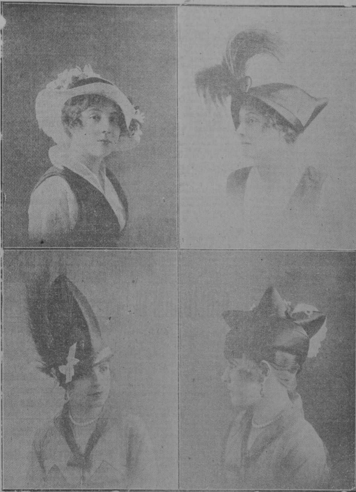
Ultimos modelos de sombreros de las casas Félix y Caravaglios