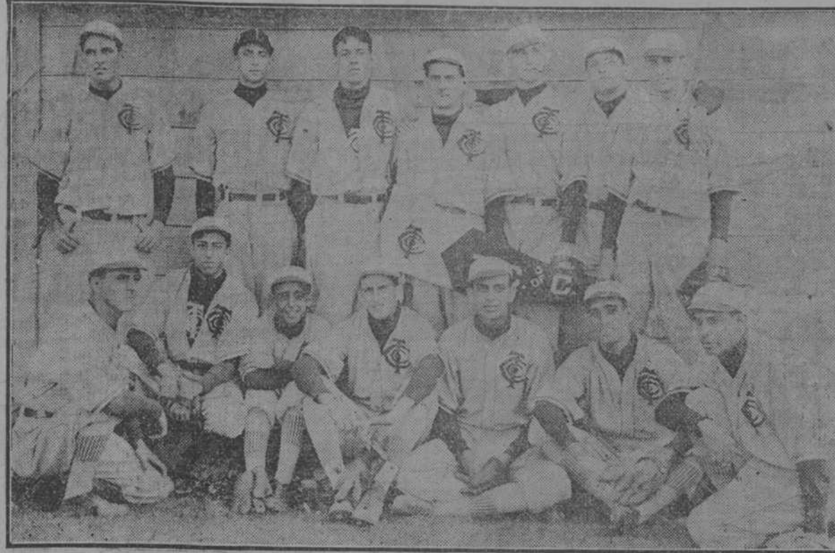
JUGADORES DEL CLUB "TRUST COMPANY"