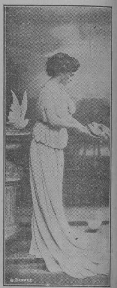
Son preciosos los cuadros que exhibe "EL ARTE" en Galiano 118. Hay allí mucho bueno que ver y que comprar...

En un drama público, entregado a la curiosidad de todos. Al volver la primera página, consagrada a la política europea, sus ojos percibieron este título: "El accidente del Monte Velan..."