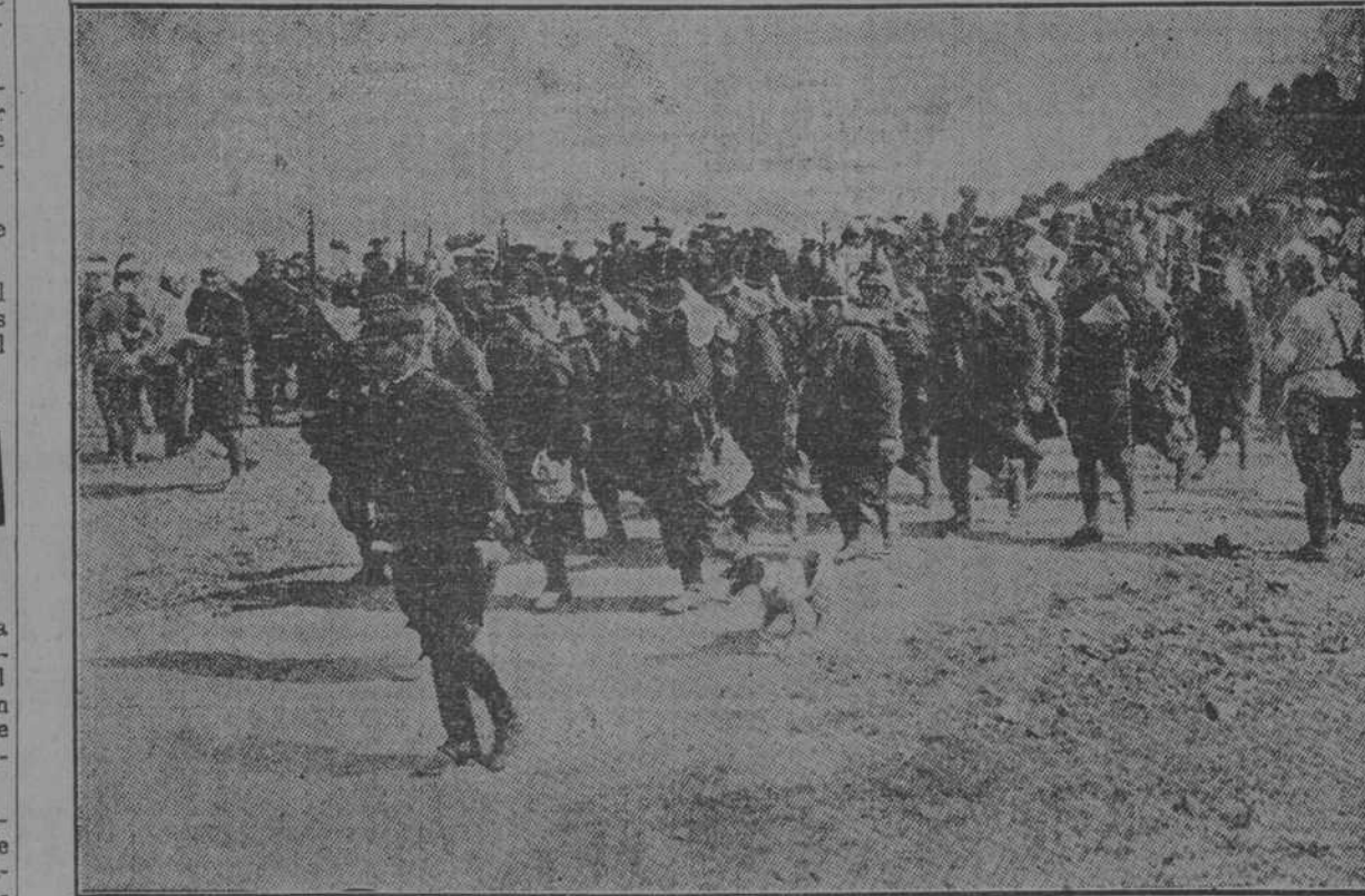
HACIA LA FRONTERA.—Una columna de infantería francesa dirigiéndose hacia el lugar de las operaciones.

Esta última plaza aun no se ha cubierto.