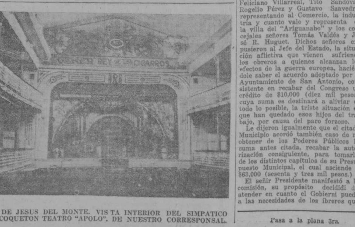
DE JESUS DEL MONTE. VIS TA INTERIOR DEL SIMPATICO Y COQUETON TEATRO "APOLO". DE NUESTRO CORRESPONSAL.

En Perpetua Juventud La juventud dorada, la edad de los gozos, no pasa para los que saben aprovecharse de la obra de los demás. Quienes tomen píldoras vitalinas, dejarán de ser jamás jóvenes, sea cual fuere su edad, porque ellas reverdecen la virilidad, dan nuevas fuerzas y energías, curan y evitan la impotencia.