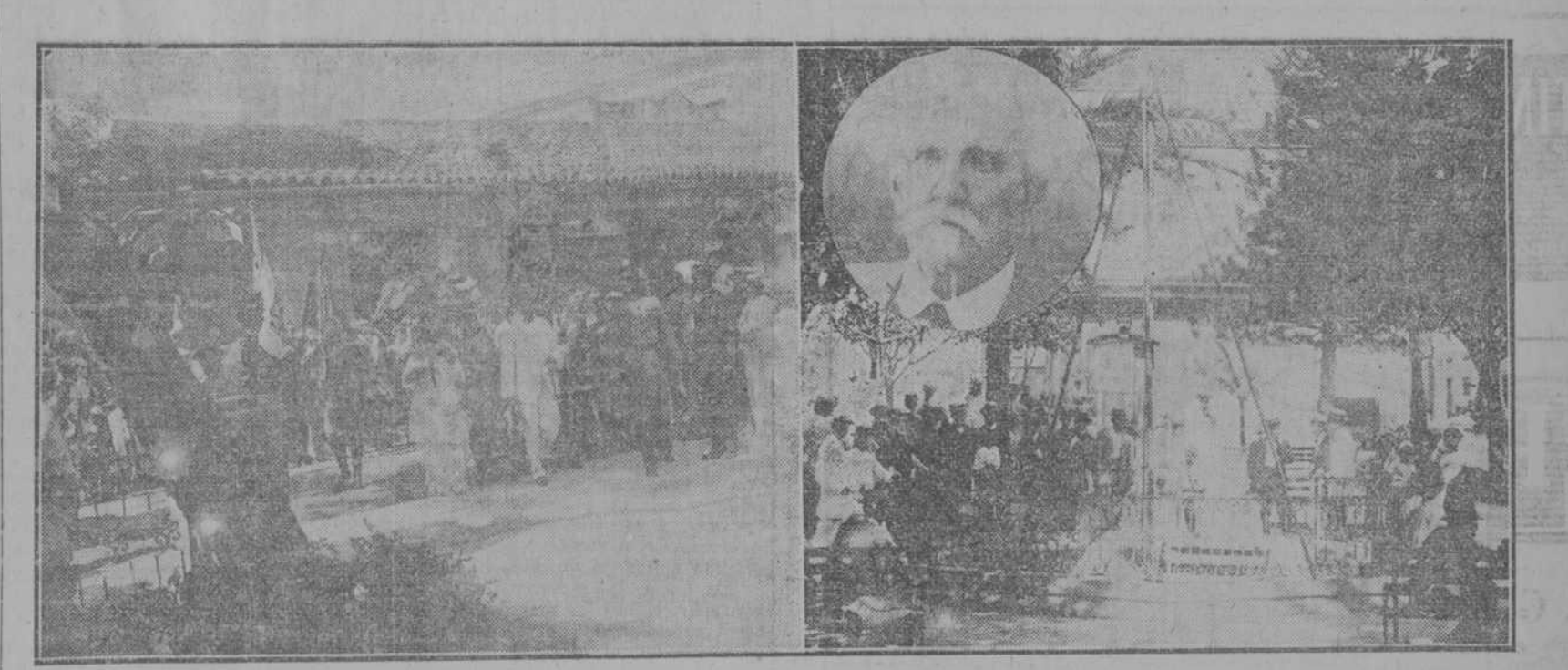
MATANZAS.—Sitio donde se erigirá la estatua al poeta Milanés.—Entrada del Presidente y su señora, en el Parque donde se alzará la estatua...