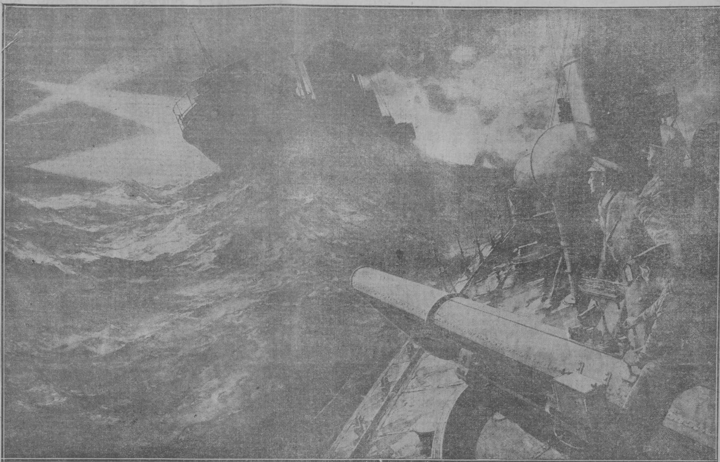
LA GUERRA EN LOS MARES

LOS ALEMANES RECHAZADOS Bruselas, 5. Los alemanes han sido completamente rechazados de Lieja y no han podido renovar el ataque.