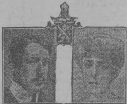
ALBERTO E ISABEL, REYES DE BELGICA

"ALEMANIA, TRAIORAMENTE, PROCURO SORPRENDERNOS; PERO ENCONTRO A FRANCIA PREPARADA". RAYMOND POINCARÉ, Presidente de la República de Francia.