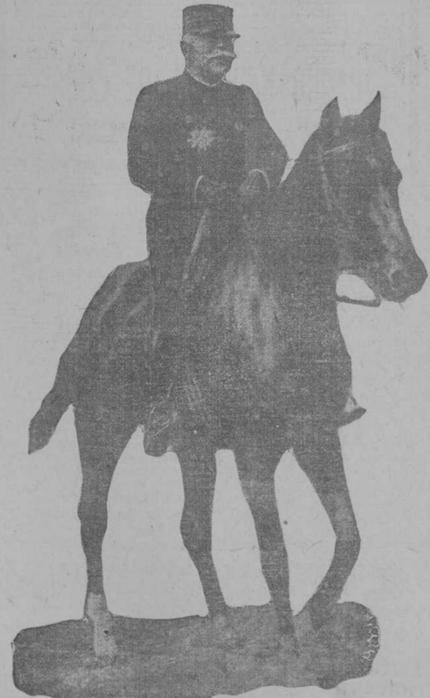
General Joffre, Generalísimo del Ejército francés, que ya ha salido para la frontera franco-alemana.