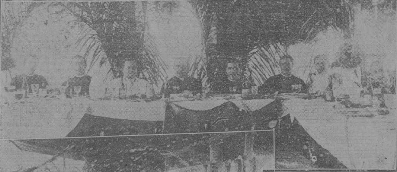
FIESTAS EN MATANZAS. Jira campestre por la juventud católica; los excursionistas; presidencia del banquete campestre; y aspecto de una de las mesas.