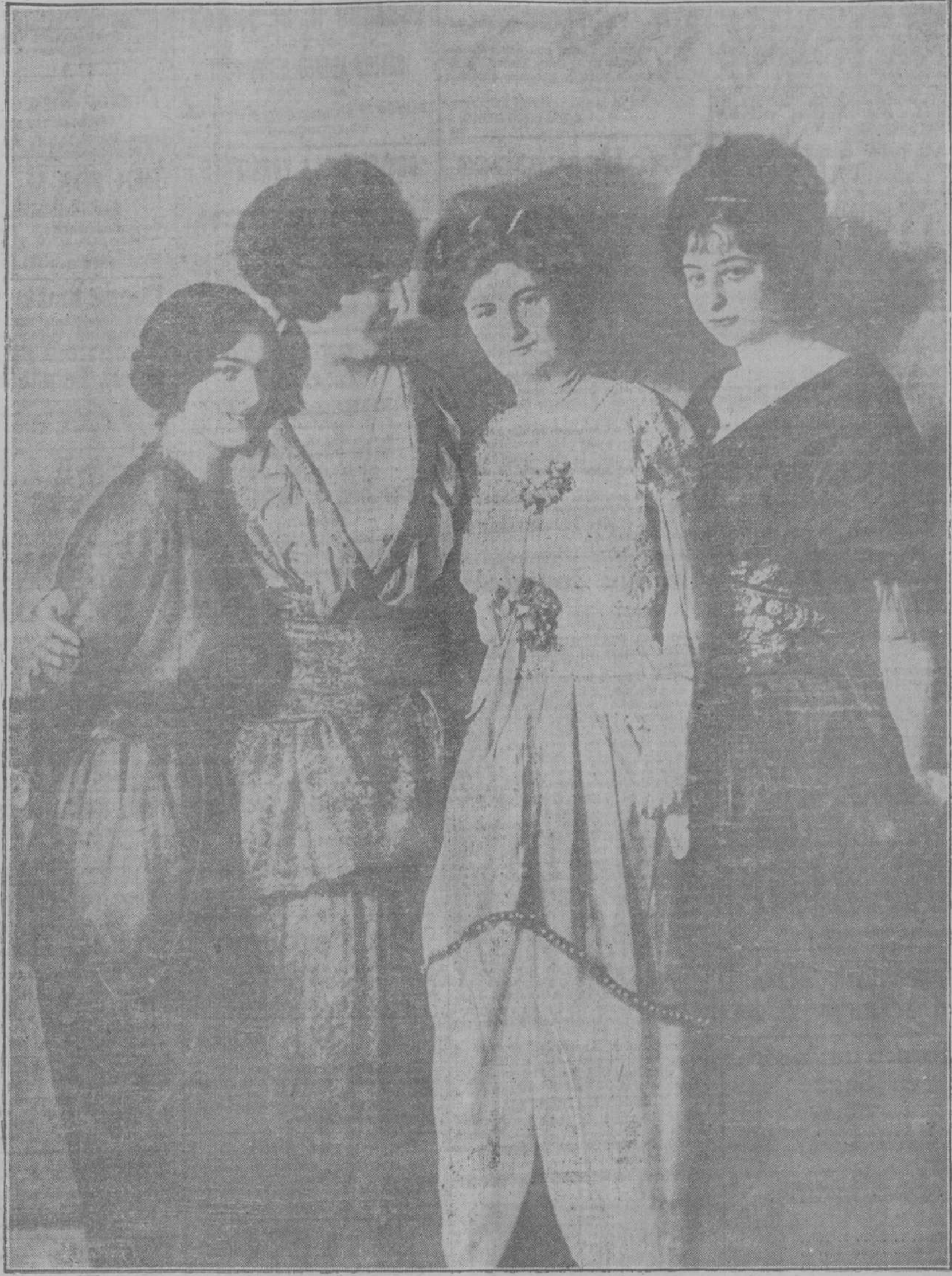
Las cuatro señoritas vencedoras en el concurso de belleza femenina organizado recientemente por los pintores y escultores de Berlín

No todos poseen este instrumento en sus dos piernas; pero cada cual con un poquito de atención puede observar señales de esta manía de censurar y de verme y tomar la misma resolución de huir de la compañía de los indios que están atacados de ella. Advertido, pues, a esos pesimistas, a esos censores morbosos,