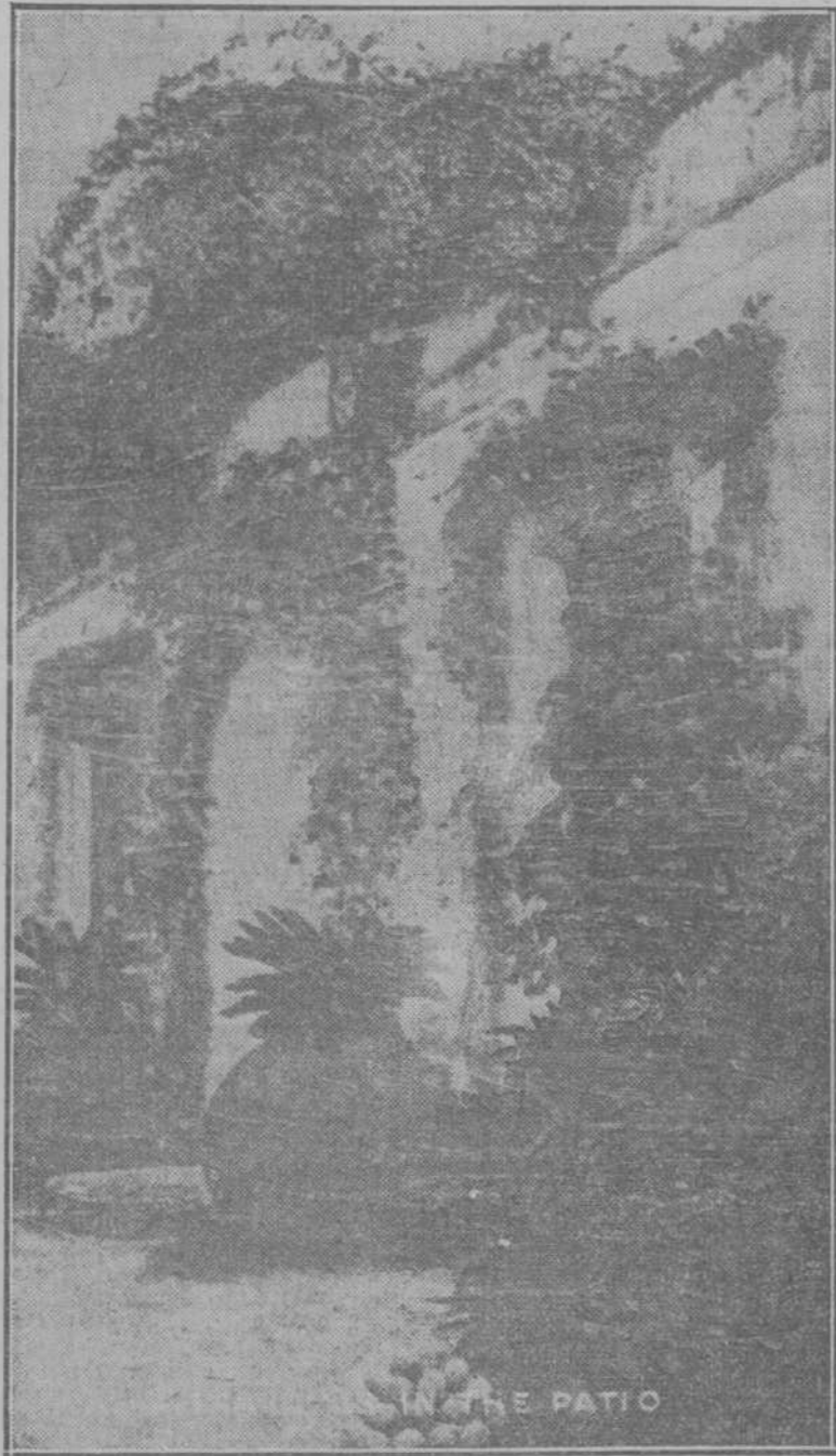
HOTEL CAMAGÜEY. — Detalles del patio con los pintorescos tinajones.

Lector, si desea disfrutar de unas vacaciones tranquilas, sumamente gratas y