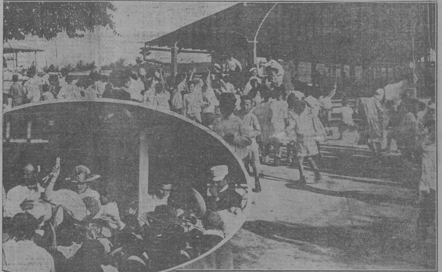
EN EL OVALO LA ESPOSA DEL SEÑOR PRESIDENTE DE LA REPUBLICA REPARTIENDO JUGUETES ENTRE LOS NIÑOS DE LA COLONIA.—LOS NIÑOS ACLAMAN AL PRESIDENTE DE LA REPUBLICA

tuvo que suspender su salida por una desgracia ocurrida en el mismo. Un tripulante había muerto de repente. Al llegar la noticia a oídos del Capitán señor Sopena, ordenó permanecer en puerto por ser de necesidad modificar la patente sanitaria, conforme a las disposiciones marítimas que así lo ordenan. Avisada la Casa Consignataria, esta se encargó de correr los trámites para la modificación de la patente, pero por ser ya de noche, tuvo que esperar hasta hoy por la mañana, para verificarlo así en el Departamento de los médicos del puerto. Dada cuenta también a la policía, se mandó a bordo al Vigilante José Lazo para que levantara acta de lo ocurrido. El cadáver del referido tripulante no pudo ser sacado anoche mismo del barco, como se pretendió, por haberse opuesto el médico de la Sanidad Americana, que es el que tiene que dar el despacho para Veracruz, y que exigió todos los requisitos del caso, obligando al capitán del "Alfonso XIII", a que esperara hasta hoy por la mañana para desembarcar el cadáver y correr los trámites necesarios. En cuanto se realicen ambas cosas, saldrá el "Alfonso XIII", lo que será probablemente después de las 8 de la mañana de hoy.