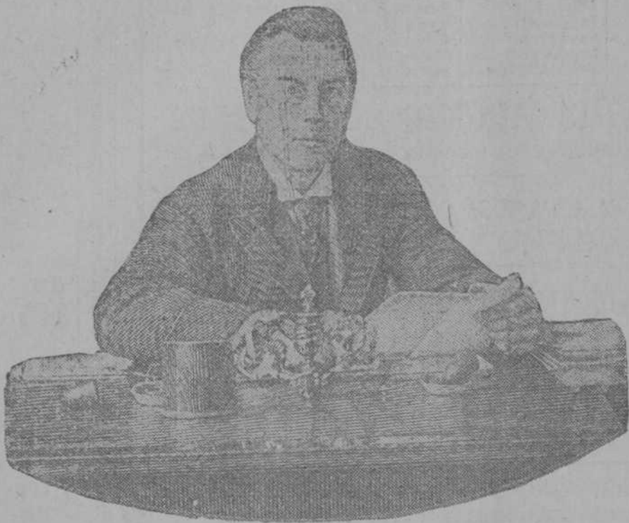
MR. CHAMBERLAIN, ILUSTRE ORADOR Y ESTADISTA INGLES QUE ACABA DE FALLECER EN SUS POSESIONES DE BIRMINGHAM.

Reparto de juguetes a los niños. Estos aclaman al Presidente y al Alcalde. La tarde de ayer en el Campamento.