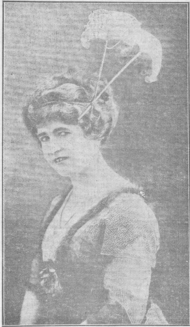
Peinado de moda con plumas de fantasía.

Critique el sabio punzante que es bueno crítica sabia Pero me da mucha rabia. Que critique el ignorante.