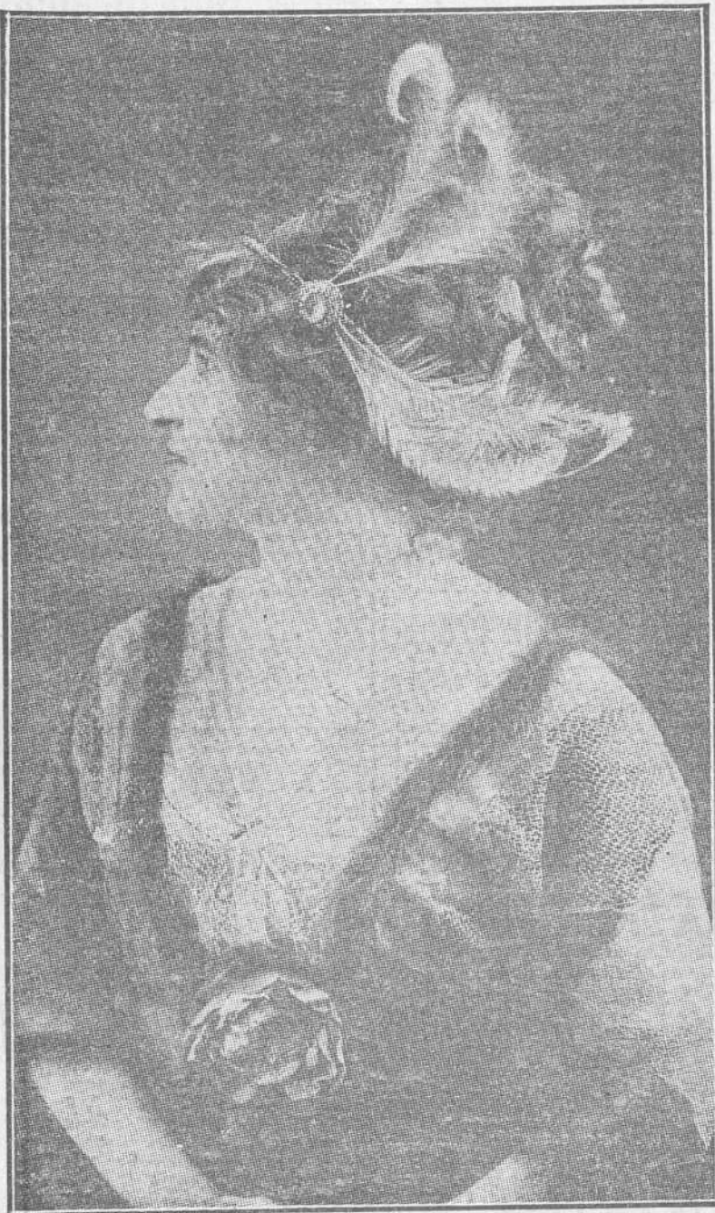
Otro peinado moderno con fantasías.