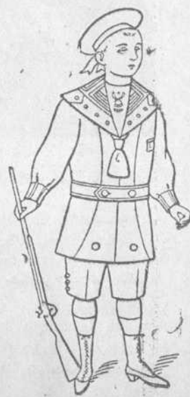
Dril Blanco. De 1 a 12 años. Precio $2.60 uno.