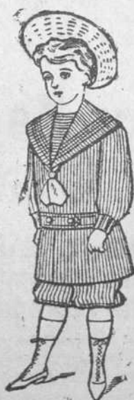
Dril Color. De 1 a 12 años. Precio $1.50 uno.