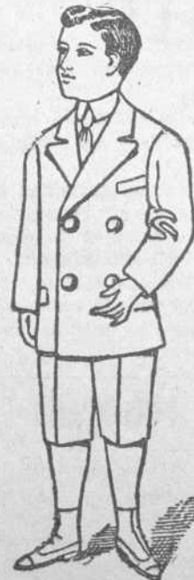
Dril Blanco Precio $3.00. Dril Crudo. Precio $3.00. Dril Color. Precio $2.60.