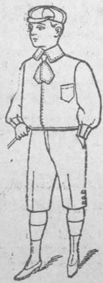
Dril Color. De 1 a 12 años. Precio $1.50 uno.

Si quieren vestir elegante a sus hijos, no dejen pasar esta oportunidad