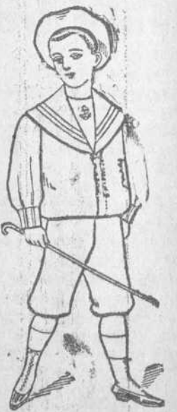
Dril Blanco. De 1 a 12 años. Precio $2.50 uno.

Visite en los altos, nuestro salón de confecciones