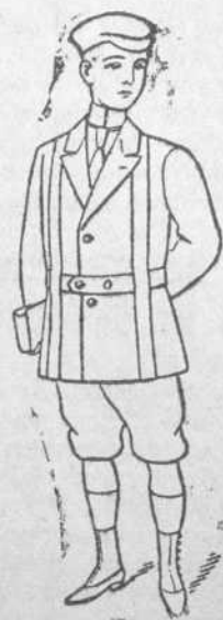
Dril Blanco. Precio $3.80. Dril Crudo. Precio $3.60. De 8 a 14 años.