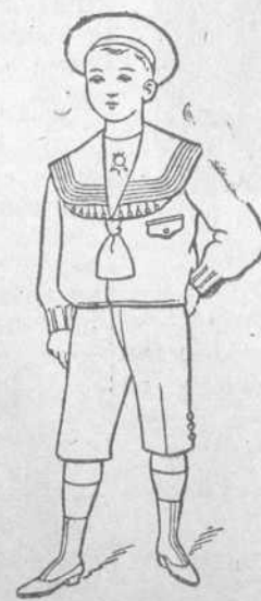
Dril Blanco. De 1 a 12 años. Precio $3.00 uno.