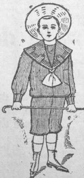
Dril Color. De 1 a 12 años. Precio $1.90 uno.