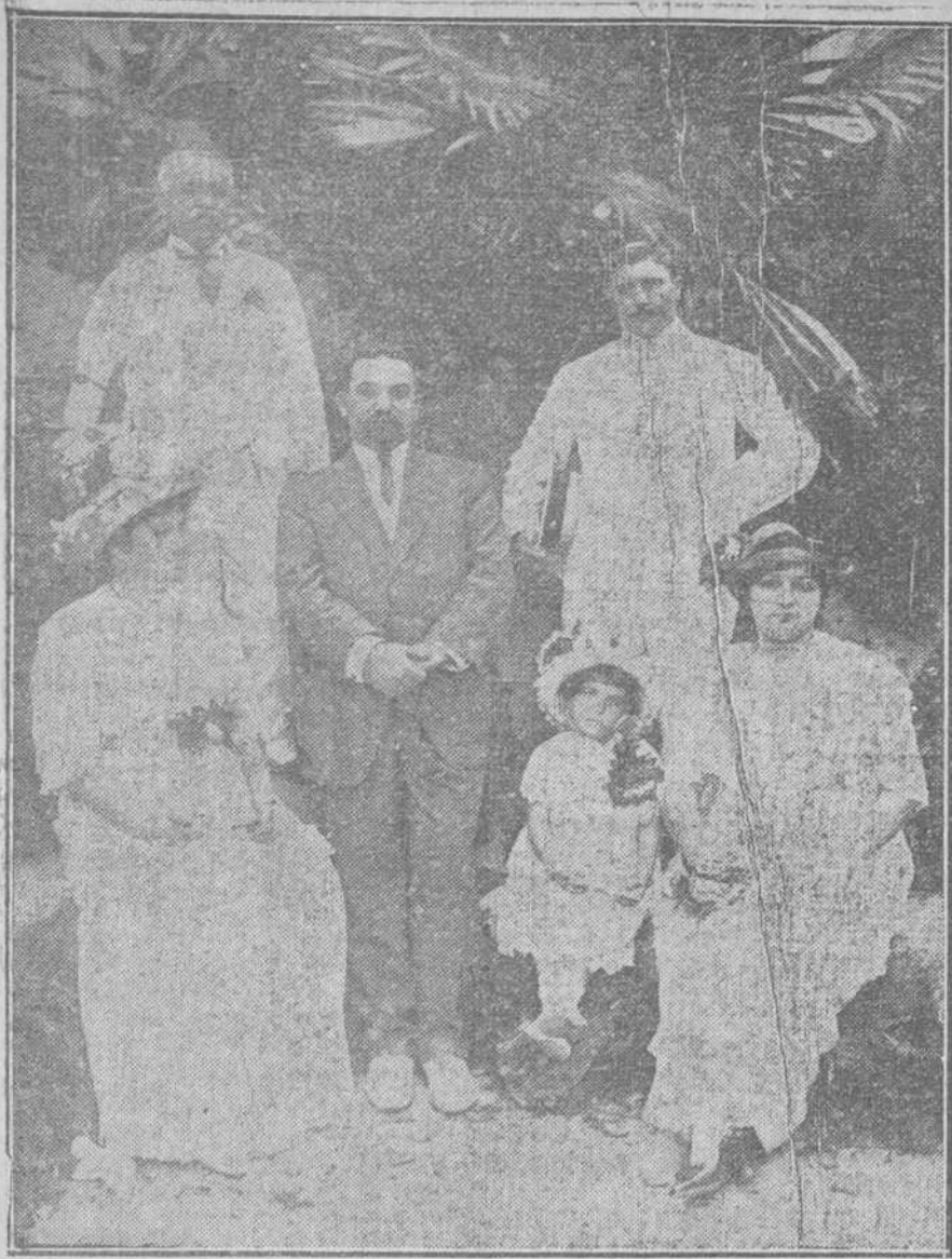
El Presidente del Club Grandalés, rodeado de su distinguida familia y algunos amigos.

Muy de mañana mi Longines, fijo como el sol, me dijo sonriendo en su pavón azuloso y cabrilleando en el oro de su ramaje: