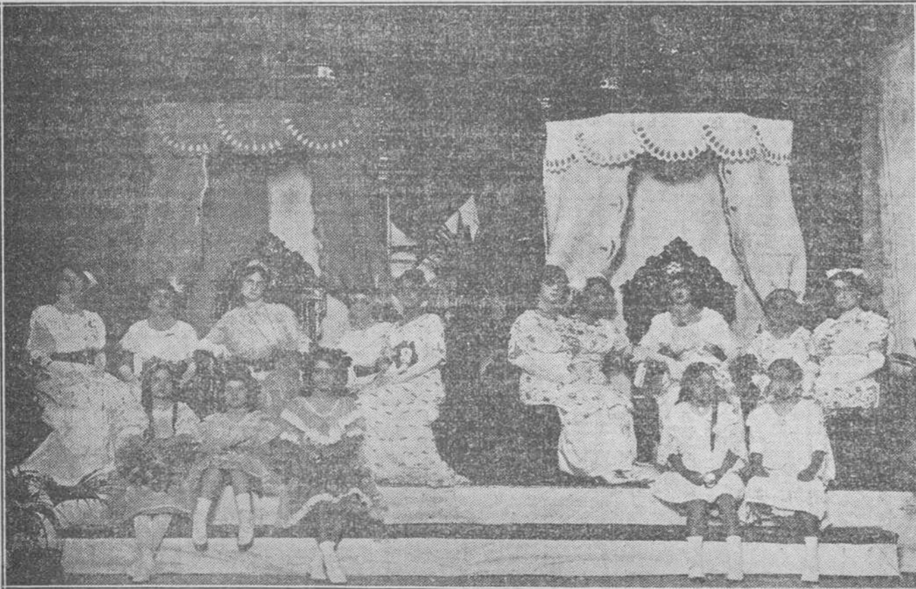
Reina y damas de honor de los bandos Blanco y Verde.

la juventud entusiasta que allí acudió, blancos los músicos, en fin, todo blanco, No hay conjunto más delicado.