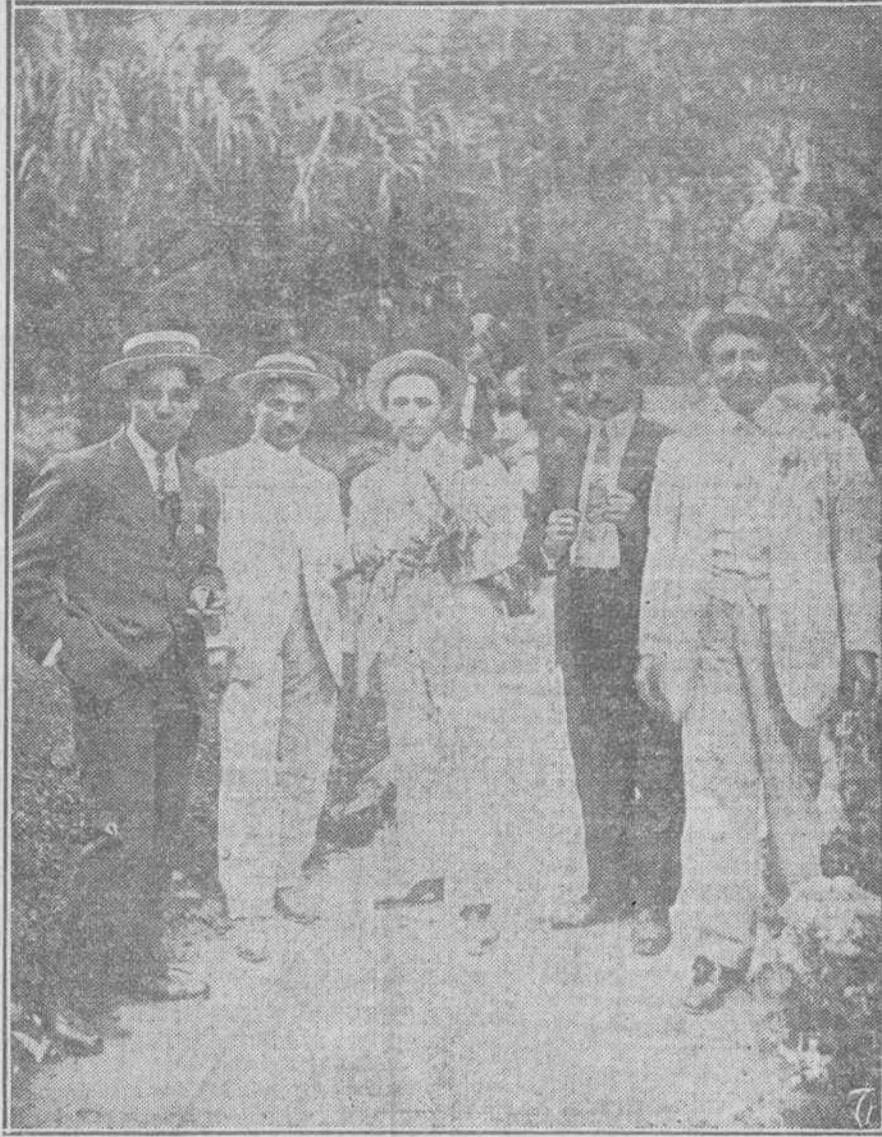
Club Grandalés. Oyendo la gaita.

Lejos cantaban la Soberana. Y el hombre de las barbas y nobles, el Capitán de los Tercios de Flandes,