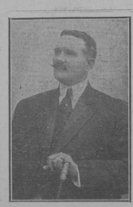
GENERAL DIONISIO ARENCIBIA Y PEREZ, Alcalde Municipal de Santiago de las Vegas. Desempeña el cargo desde Marzo de 1907.