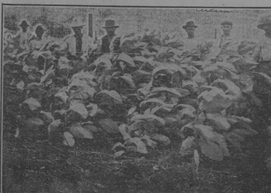
Hermoso campo de tabaco de la finca "Santibáñez", de Artemisa.

También se celebrarán todos estos días misas cantadas y sermones.