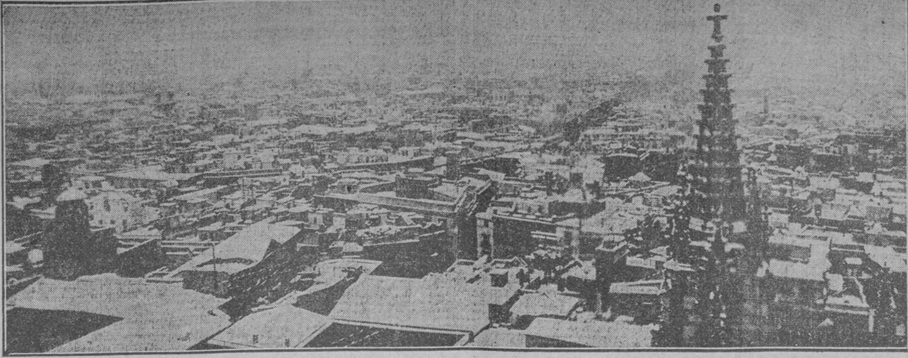
LA GRAN NEVADA DE BARCELONA.—Un aspecto del casco antiguo de la ciudad. Vista tomada desde el campanario de la Catedral basílica en la tarde del jueves 15 de Enero. En la sección cablegráfica del DIARIO se dió una extensa información de la nevada.