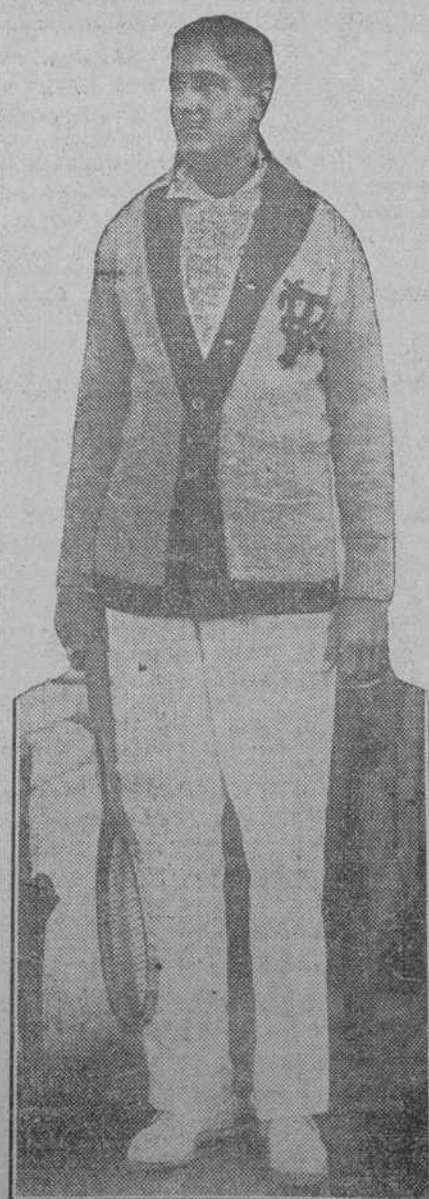
CONDE DE JARUCO

Toca a su término el campeonato de "lawn-tennis" organizado por la aristocrática sociedad cuyo nombre encabeza estas líneas.