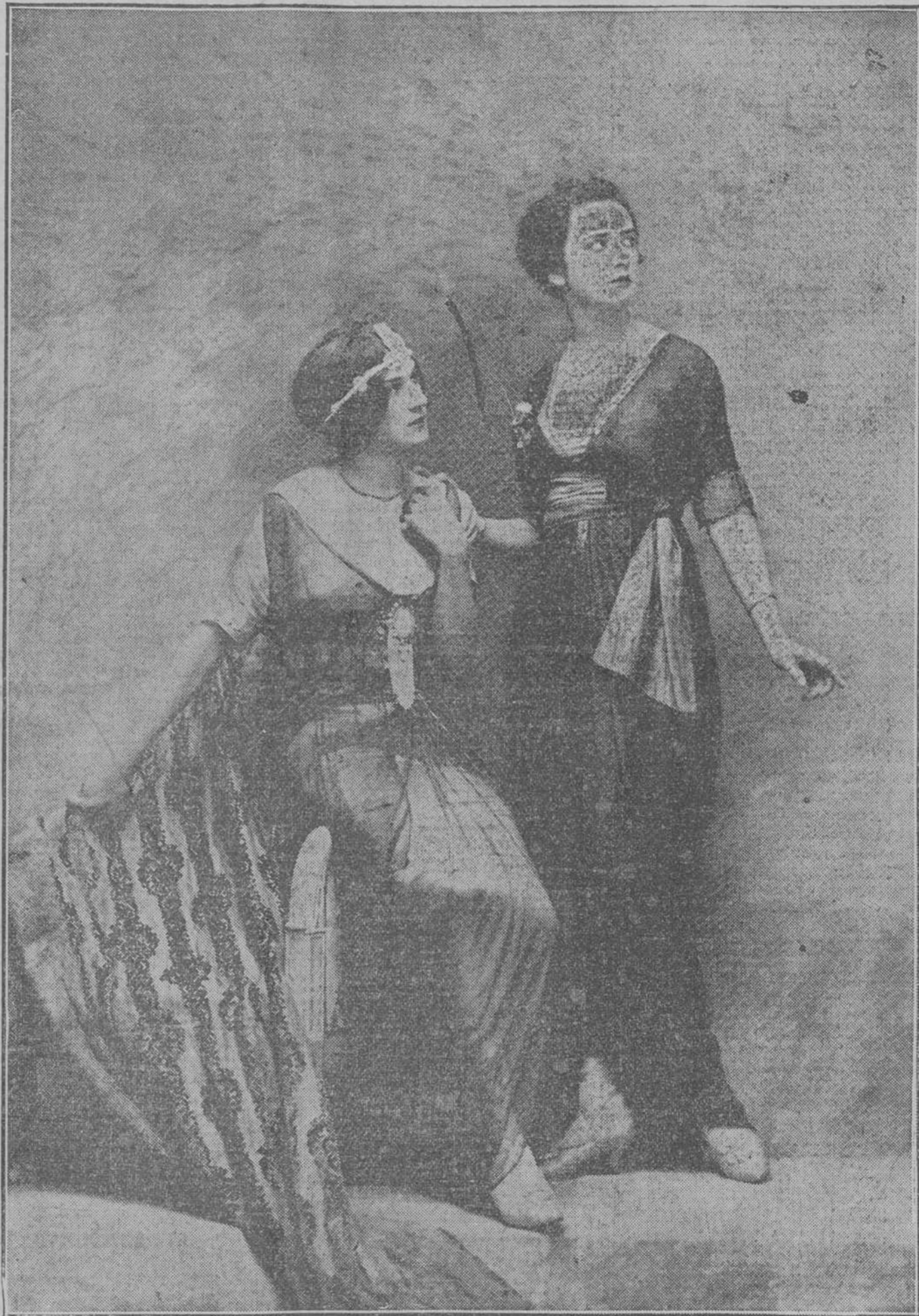
Trajés de gasa propios para comida, modelos de la casa Lucile.