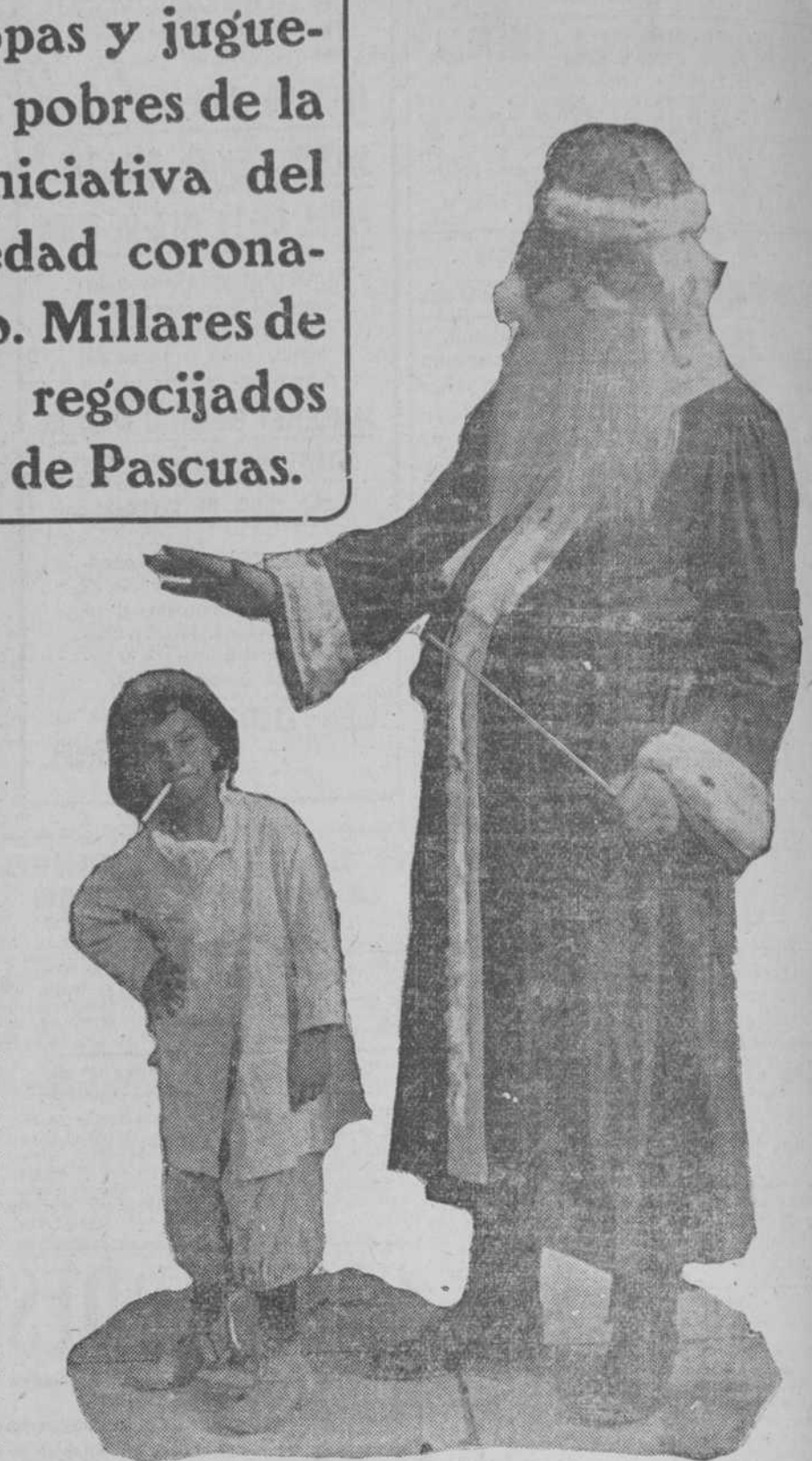
Santa Claus con uno de los niños que concurrieron al festival.