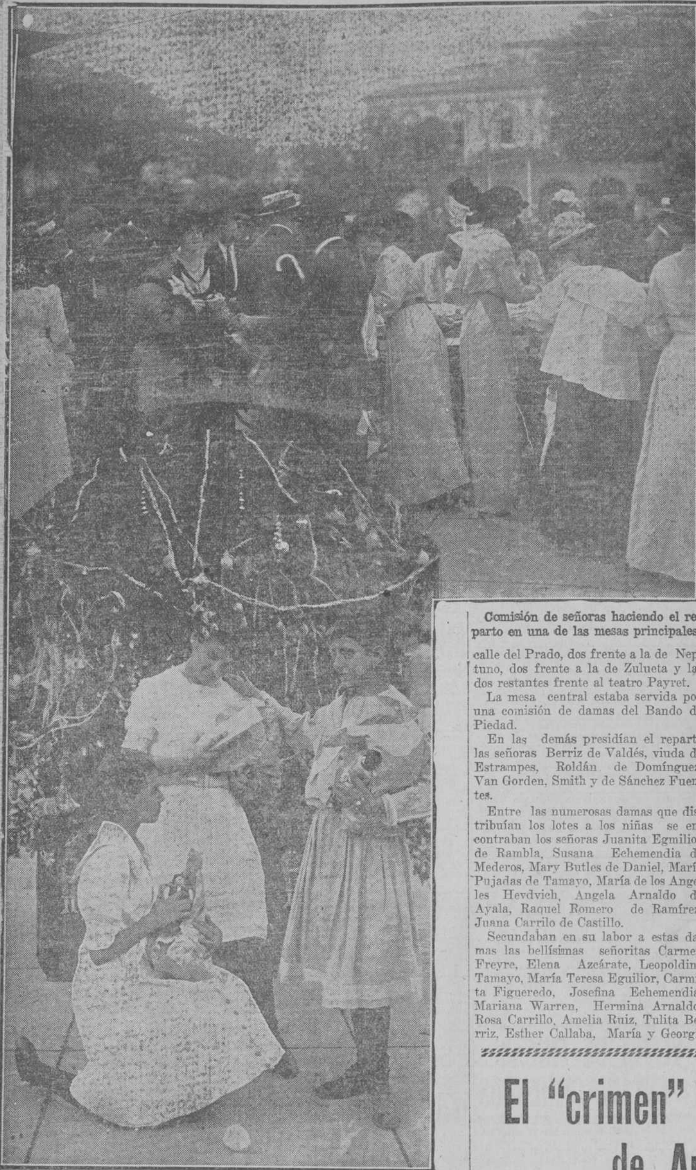
Comisión de señoras haciendo el reparto en una de las mesas principales.

calle del Prado, dos frente a la de Neptuno, dos frente a la de Zulueta y las dos restantes frente al teatro Payret.