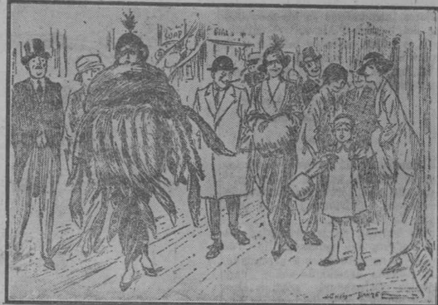
—¡Ay, mamá! ¡Qué cosa tan rica! ¡Una señora que vende pieles. (Punch, de Londres.)