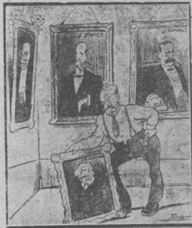
Romanones.—Solamente me falta colorar éste. (España Nueva, de Madrid.)