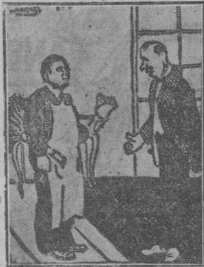
—De parte del sastro han traído para el caballero este ramo de micotis. —No entiendo... —El micotis, señor, significa: "No me olvides..." (La Razón, de Buenos Aires.)