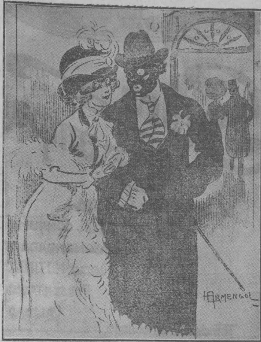
—Para no llamar atención, si te preguntan dí que soy tu hermana. (L'Amour, de París.)