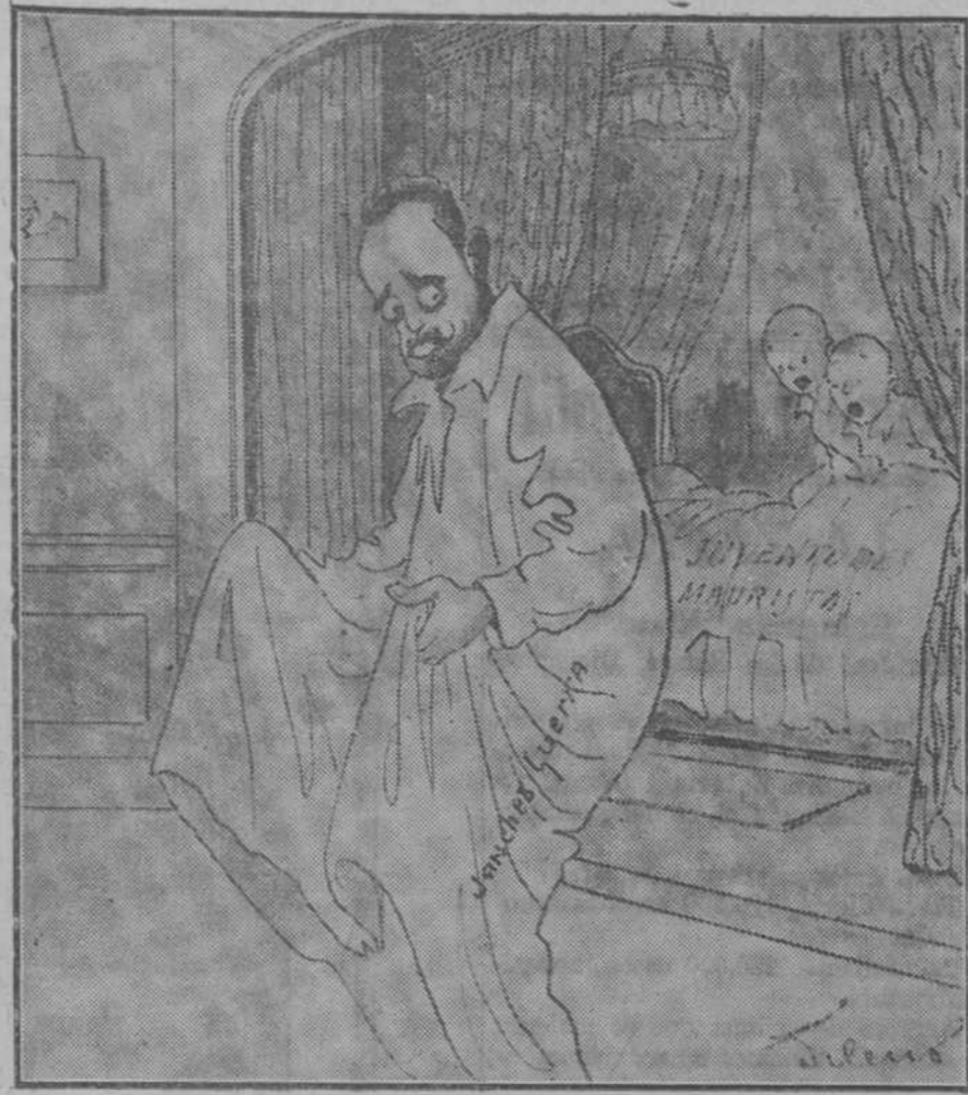
—¡Angelitos! ¡Bueno me han puesto! (Gedeón, de Madrid.)