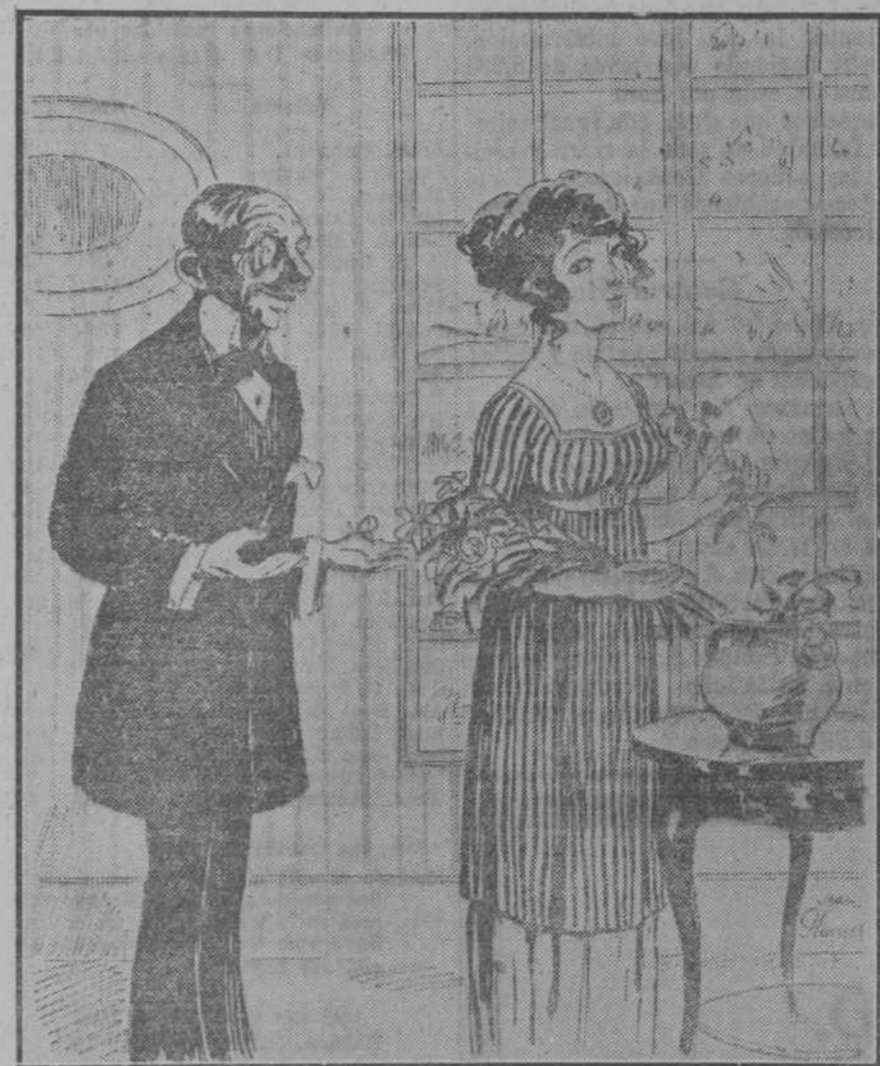
—Pues todo el mundo encuentra que parezco muy joven para mi edad. —Para su edad puede ser, pero no para la mía. (L'Amour, de París.)