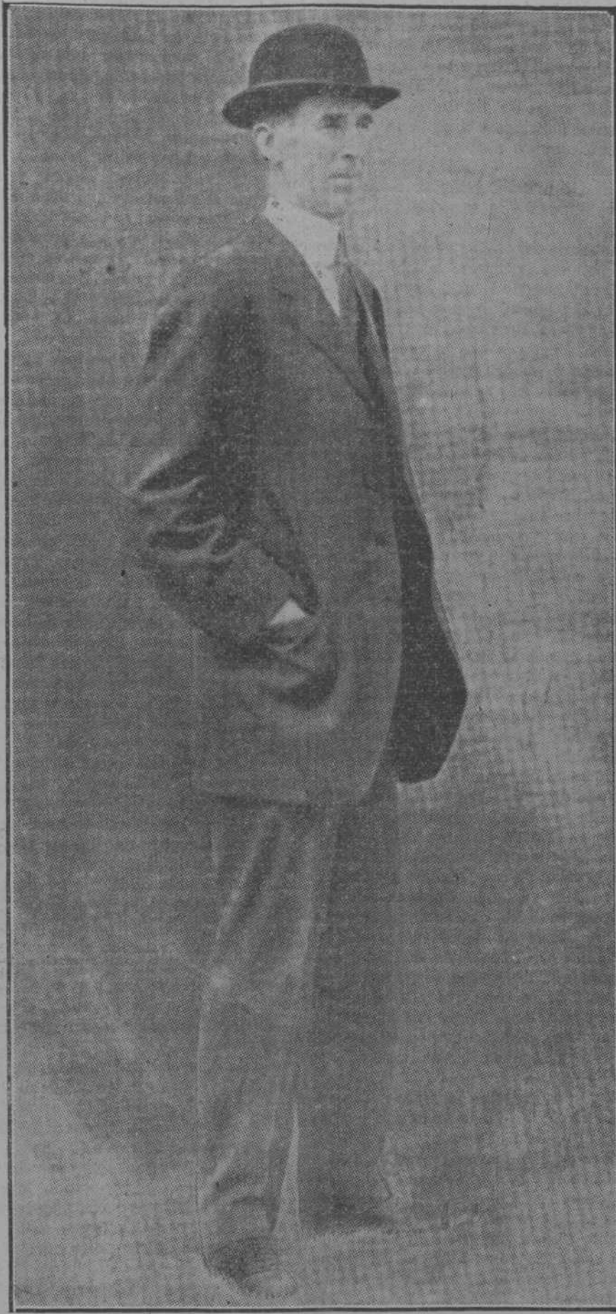
"Manager" del "Philadelphia", Champion Mundial.