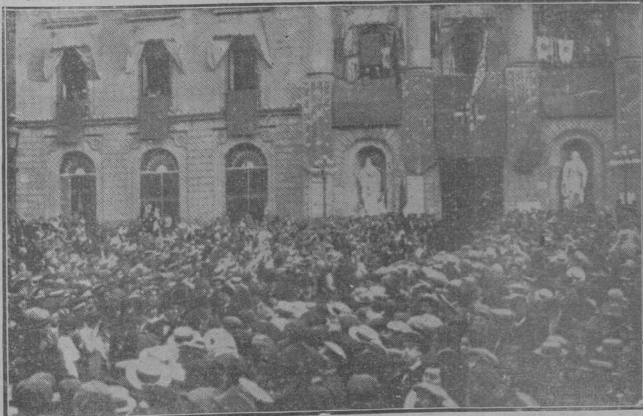
MANIFESTACION IMPONENTE EN BARCELONA.—El público congregado el 24 de Octubre último en la plaza de San Jaime, tributando una calurosa y entusiasta ovación a los representantes de las cuatro provincias catalanas, después de celebrarse en el Salón de San Jorge la primera sesión de la Asamblea de las Mancomunidades.