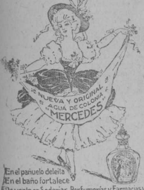
En el pañuelo deleita En el baño fortalece De venta en Sederías, Perfumerías y Farmacias

VINOS... EL IRIS AZAFRAN... EL IRIS PIMENTON... EL IRIS Y ALPARGATAS... EL IRIS