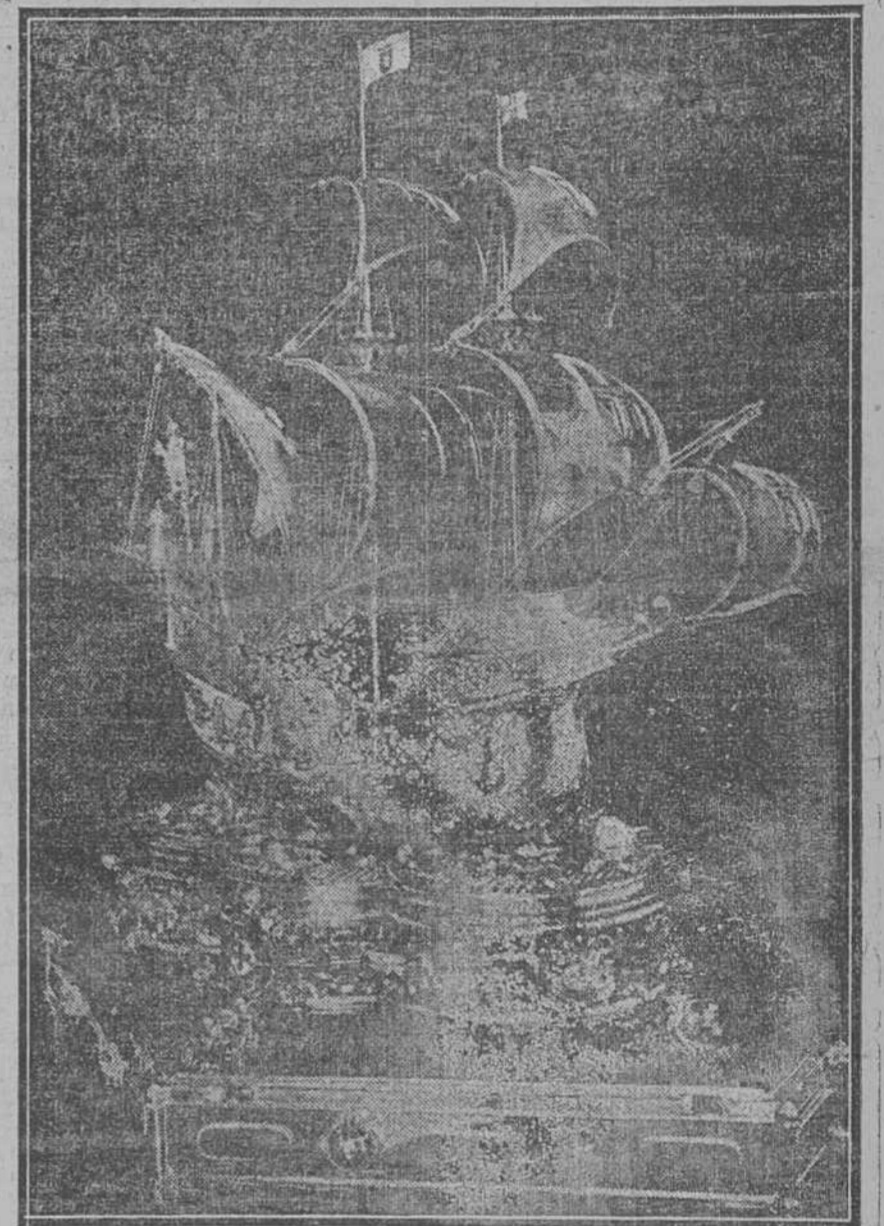
El regalo de boda que los realistas portugueses enviaban al ex Rey Manuel, y que fué detenido en la Aduana de Lisboa por causa de una inscripción que decía: "De la ciudad de Lisboa a su Rey." (Una de las dos únicas fotografías que no han sido prohibidas por la censura portuguesa.) Véase la página diez.