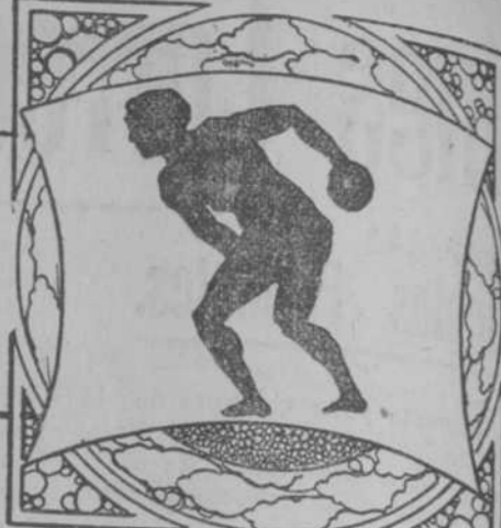
Por Ramón S. de Mendoza