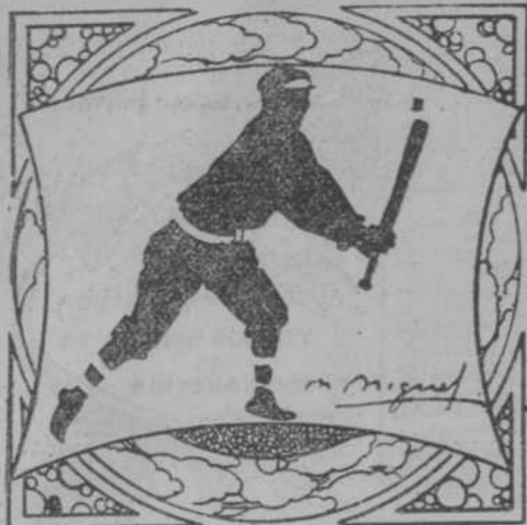
Por M. L. de Linares