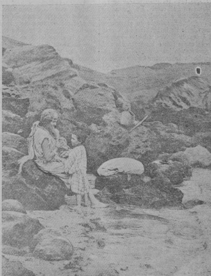
En la playa de Larache.—¡Fugitivos!