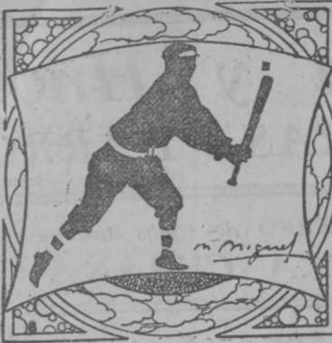
Por M. L. de Linares