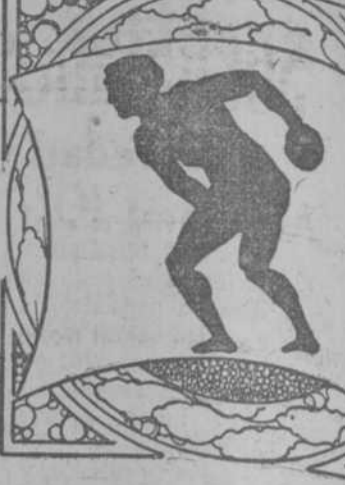
Por Ramón S. de Mendoza