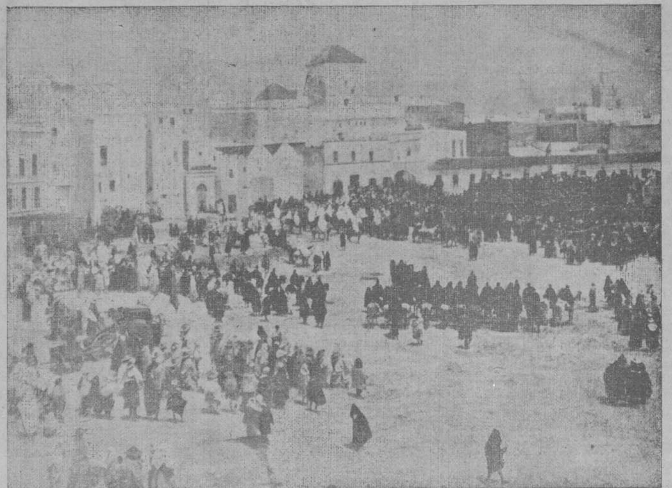
Fuerzas del Ejército español y dos secciones de caballería del tabor indígena ocupando la plaza de España en Tetuán con motivo de la reciente agitación.