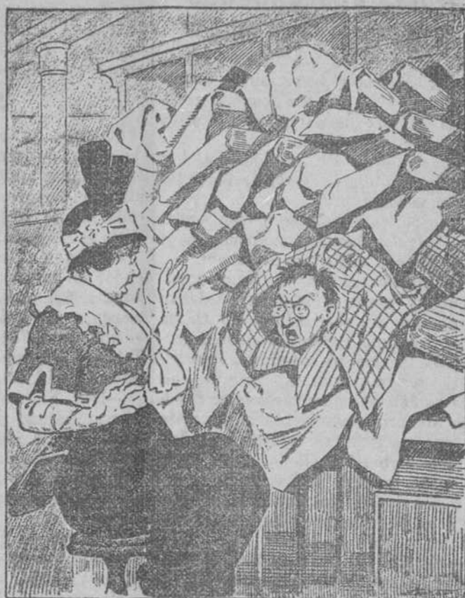
—Señora, es todo lo que hay.