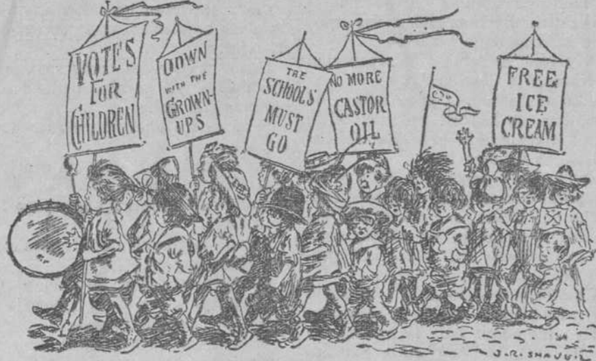
El partido infantil reclamando el voto para los niños, el fin del mando de los "grandes," la supresión de las escuelas y del aceite de hígado de bacalao, y el mantecado gratis.