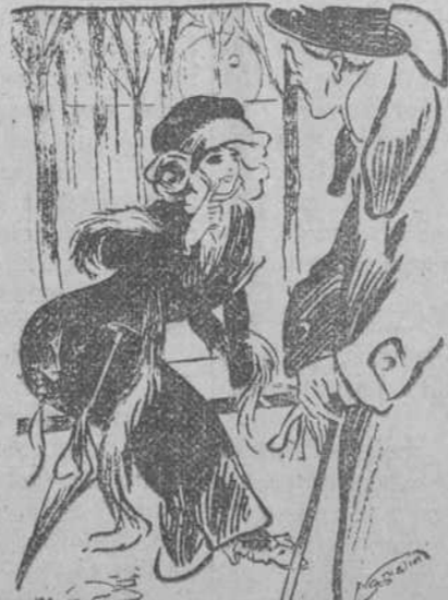
—¿Que no es mio este pelo? Si-tú quieres ver lo que he pagado por el puedo enseñarte la cuenta.