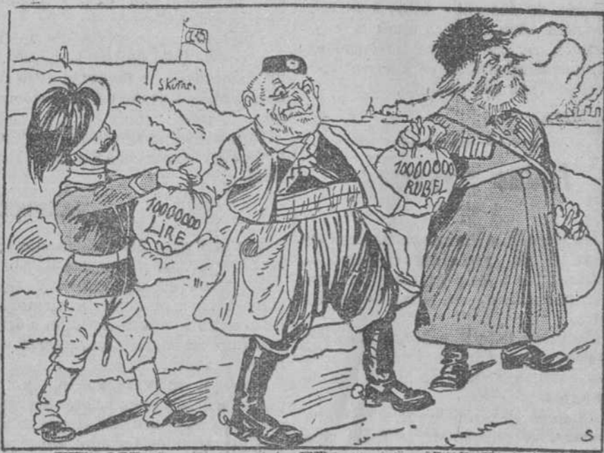
Nicólae.—¿Qué pasaría si yo tuviese as manos libres?