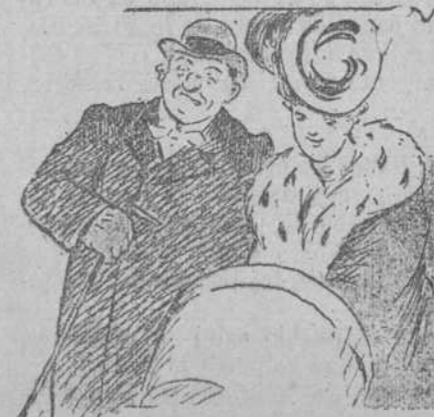
—No, señor, no me disgusta que vaya usted a mi lado. Cuanto más feo es un tipo, más luce la que va a su lado, y más se la mira.