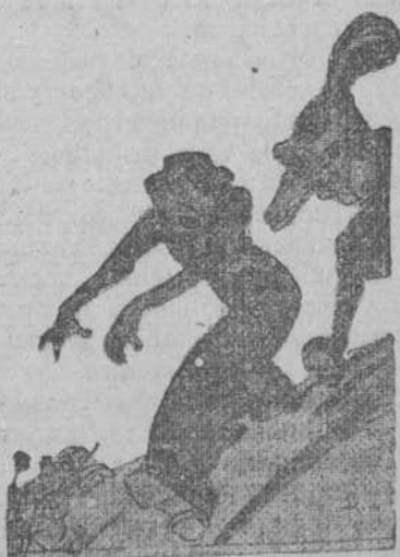
Cupido huye de los marimachos.