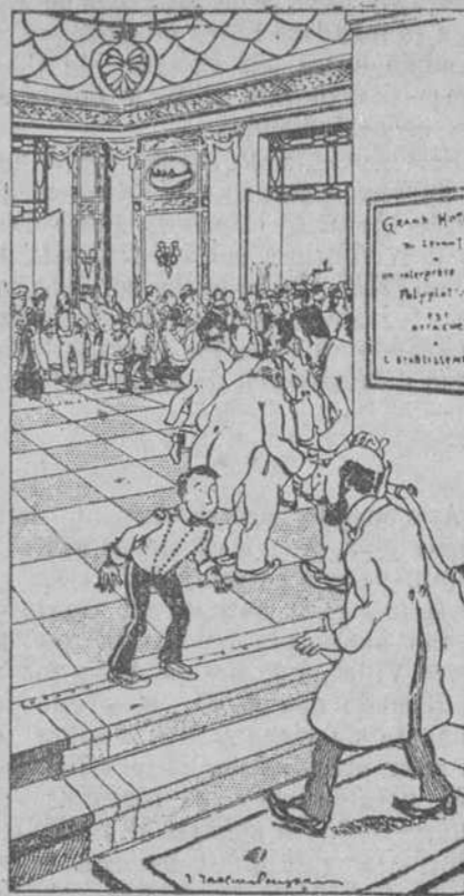
—¿Señor, señor! El poliglota acaba de morderse la lengua!