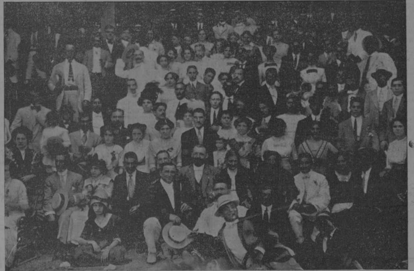
EL PRESIDENTE DE CHANTADA Y CARBALLEDO RODEADO DE LA DIRECTIVA Y DE NUMEROSOS ROMEROS, EN PALATINO