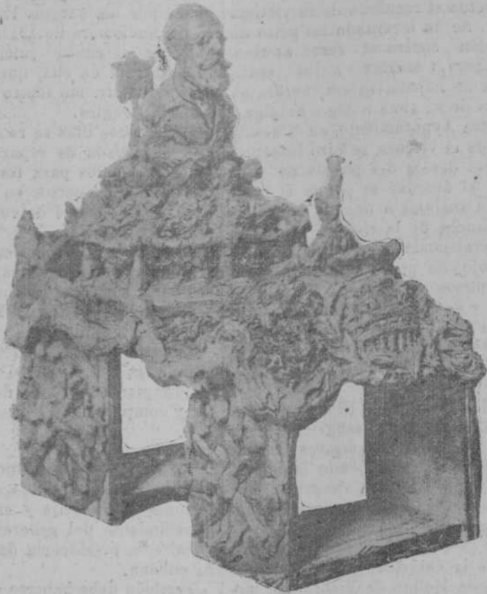
ORENSE FRATERNAL.—Boceto de la Carroza Poesía. Una de las que formará parte de la Gran Cabalgata.

pulpeiras; la taberna de follato con el fragante vino d-o Riveiro por cuenca servido, las esponjosas empanadas, el fibroso lacón, la apetitosa bitela con allo e prunto, los pastosos chourros. Kioscos artísticos, repletos de fina repostería, los clásicos Culeiros e Trepés, con la exquisita almendra de Cazo y el milindr, las banquetas típicas, con las roquillas, o-c cabalos d-o demo, las reliquias d-a santía, el ans de fiollo, el dorado risóllo, los guelpos con ferreñas nocces, "avelás"... a-s figas pro miniño; todo ello proporcionado a precios módicos, corrientes, fijados en grandes carteles, serán prenda segura de satisfacción material y espiritual delecte para un Xantar campestre, desprovisto de formalismos vanidosos, sobre oloroso campo d-aa "maravillas."