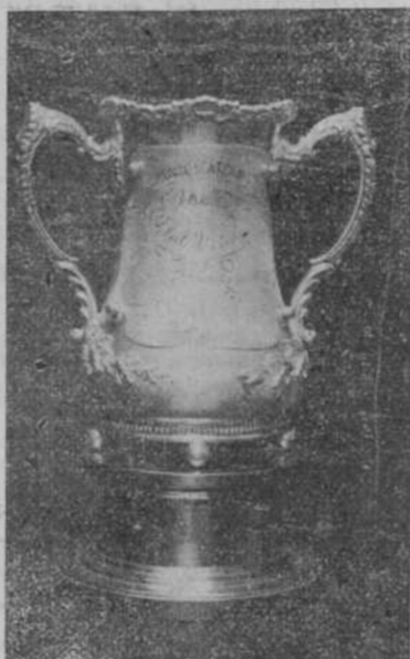
ORENSE FRATERNAL.—La Gran Copa que disputarán los teams de Foot-Ball inscriptos.

Amplio salón conducirá a la fiesta, en medio de pilstras sosteniendo caprichosas farolas, realizadas por banderas y gaitardetes nacionales y unidas a doble can-