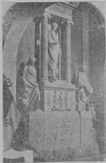
SEPULCRO DE SIMON BOLIVAR