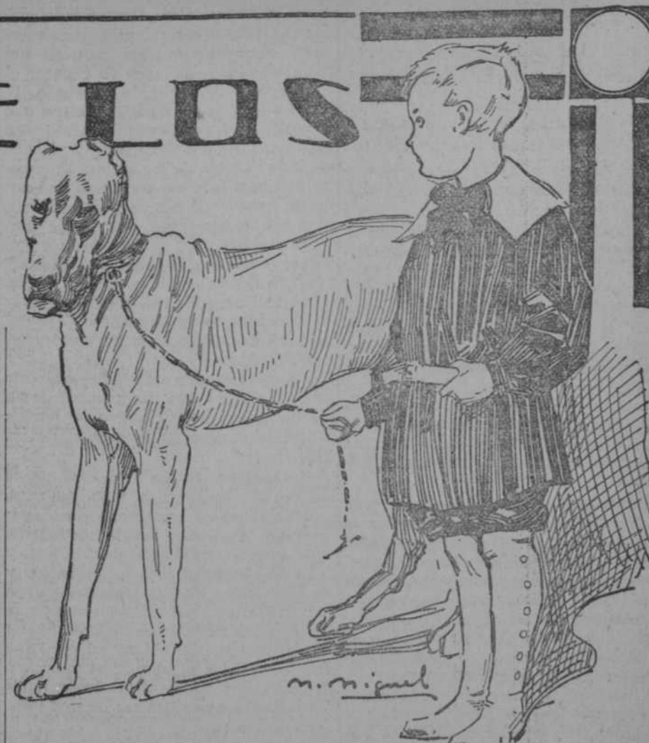
Cuento para niños