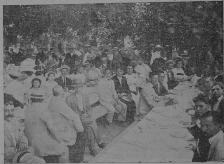
ASPECTO DE LA JIRA