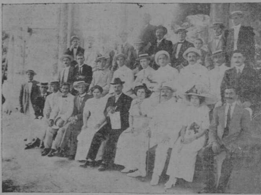
JUNTA DIRECTIVA DE LA SOCIEDAD "ALIANZA DE VILLAMARIN"

Los hijos de la región gallega, la humilde, la risueña, la hermosa, son gentes sencillas, trágicas y milagreras según el decir de un manco insigne que se llama don Ramón del Valle Inclán. A lo cual contestamos nosotros que eso será por allá, que por acá, los gallegos, son gente que lucha, que trabaja, que ahorra, que se alia para divertirse y confundirse en el abrazo fraterno y se asocia para llevar á cada rincón dinero para propagar la cultura, para sostenerla, para educar á sus paisanos con el amor á la tierra, al hogar y á la patria, y por lo tanto á la bandera.