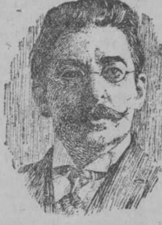
DON JOSÉ ENRIQUE RODÓ

El Dr. José Toribio Medina, es autor de varias obras de bibliografía americana y de las historias del Tribunal del Santo Oficio de la Inquisición en las colonias hispano americanas. Ha publicado unos cuantos volúmenes de documentos históricos relativos a Chile colonial. Es miembro correspondiente de las Reales Academias de la Lengua y de la Historia y de muchas otras.