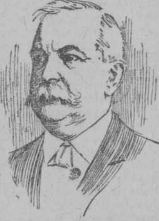
DR. ENRIQUE JOSÉ VARONA