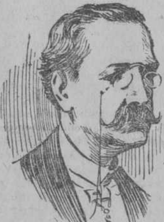
DON RICARDO PALMA