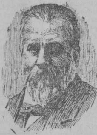
D. MARCELINO MENÉNDEZ Y PELAYO