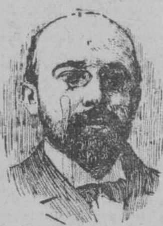
DR. JOSÉ TORIBIO MEDINA

Los más eminentes eruditos del Nuevo Mundo unieronse a los de Europa para llevar a cabo esta obra monumental, La BIBLIOTECA INTERNACIONAL DE OBRAS FAMOSAS, en 27 magníficos volúmenes; Biblioteca digna de atención de los estudiosos, al par que rebosante de interés hasta para el lector más indiferente.