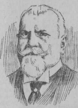
DON JUSTO SIERRA