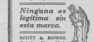
Ninguna es legítima sin esta marca.

Estos achaques no se curan con remedios "cáralo todo," sino con alimentos que fortifiquen el cuerpo y regeneren la sangre, y la Emulsión de Scott es el alimento más concentrado que existe y el regenerador de la sangre por excelencia.