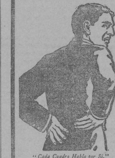
"Cada Cuadro Habla por Sí."

Dolor de espalda y dificultad al orinar son señales de peligro y de que los riñones están tupidos y congestionados, que el sistema se está llenando con ácido úrico y otros residuos venenosos que debían haber sido pasados en la orina.