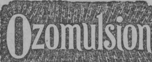
La Nueva Emulsión de Aceite de Hígado de Bacalao por Excelencia.

Está desapareciendo el color de su preciosa faz? Se encuentra débil, débil y de mal humor? Cuando esto sucede el corazón de la madre está triste; ella anhela algo que devuelva el encanto de la salud a las tiernas mejillas del infante; quiere algo que le dé vigor a su cuerpecito. Nada podrá dar este resultado mejor que la Ozomulsión . Esta Medicina-Alimento es agradable al paladar como la leche y tan fácil de tomar. Da a los Niños carnes y fuerzas. Devuelve el color a sus pálidas mejillas y coloca sobre las mismas los preciosos hoyuelos que hacen al corazón de la madre tan feliz. El Niño obtendrá los mejores resultados de la primera dosis.