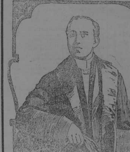
Portrait of a man, likely a political figure mentioned in the text.