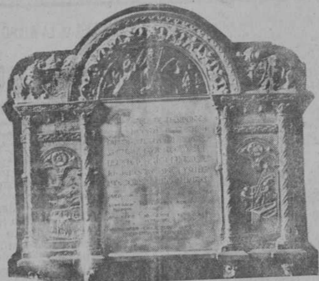
Placa en la que consta el nombramiento de Presidente Honorario de la Archicofradía del Apóstol