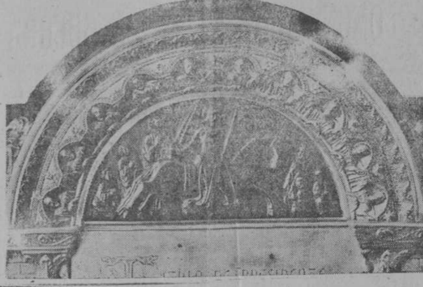
Detalle de la placa en la que se admira la delicada pieza de azabache que figura en la misma

de Castilla, dignos mandatarios para hacer entrega oficial al CAU-DILLO, AL SALVADOR DE ESPAÑA, AL JEFE DEL ESTADO ESPAÑOL EXCMO. SR. D. FRANCISCO FRANCO BAHAMONDE, de la artística placa en la que consta el nombramiento de PRESIDENTE HONORARIO, que le había sido concedido en el pasado junio, en la brillante jornada realizada por tan importante ASOCIACIÓN en la ciudad de Burgos.