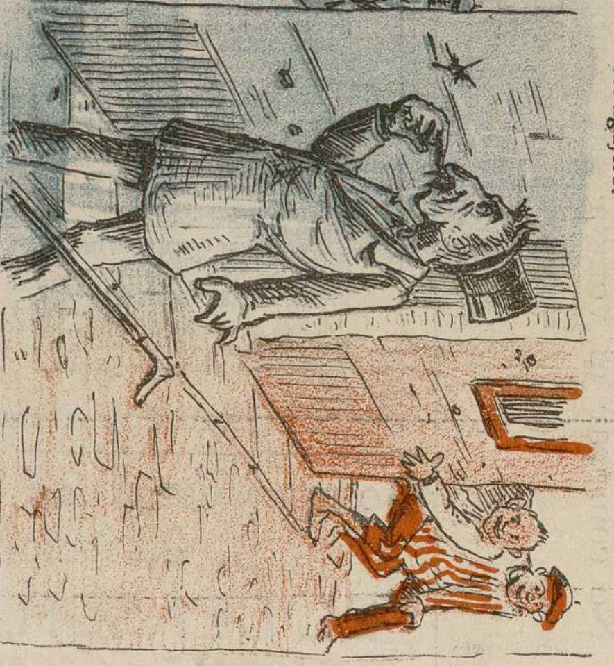
—¿A que huele? —¡¡A gobierno conservador!!