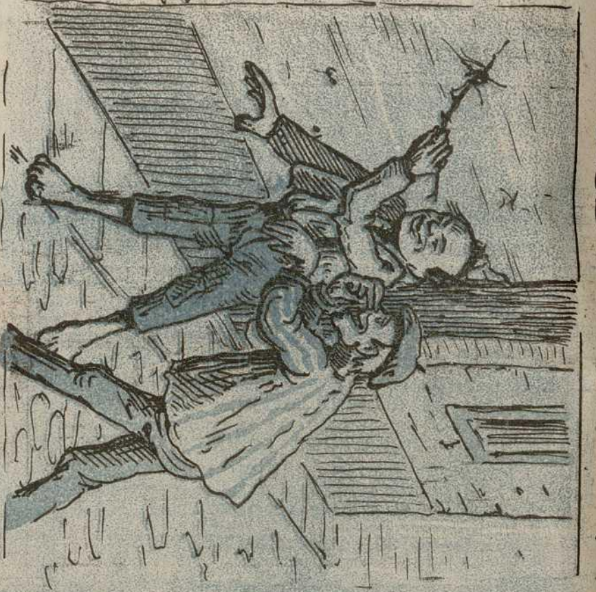
2. Donde unos chicos, meten disimuladamente, algo que ofende el sentido del olfato.