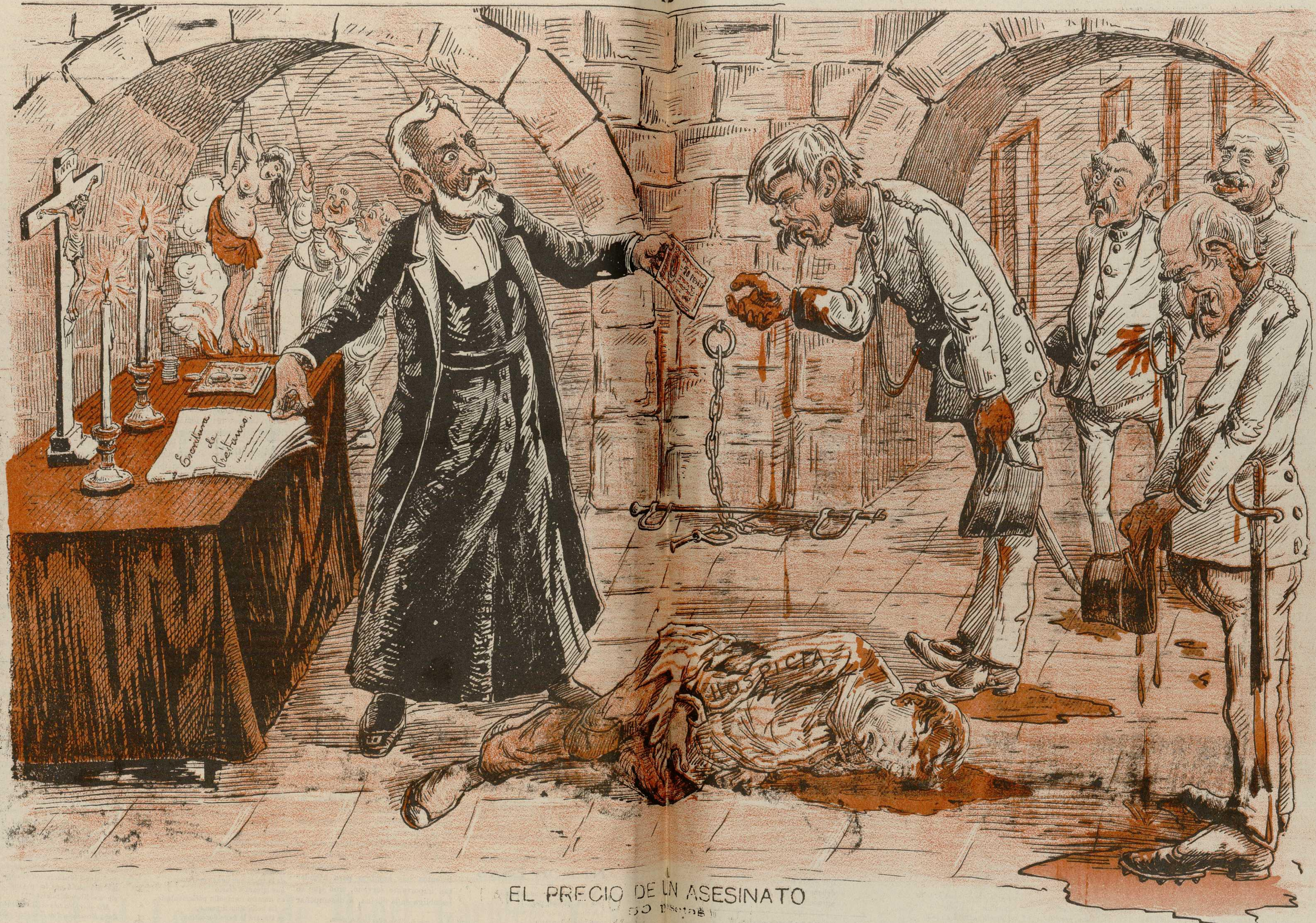
EL PRECIO DE UN ASESINATO