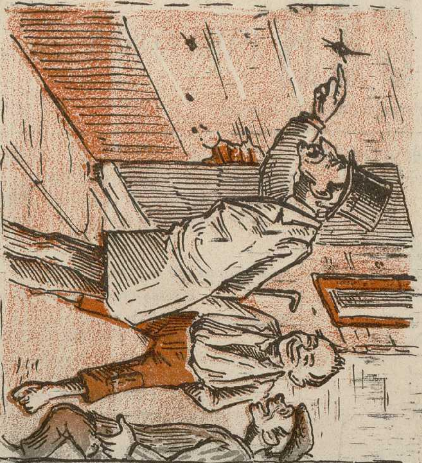
4. Hasta que consiguen que el curioso meta el dedo.