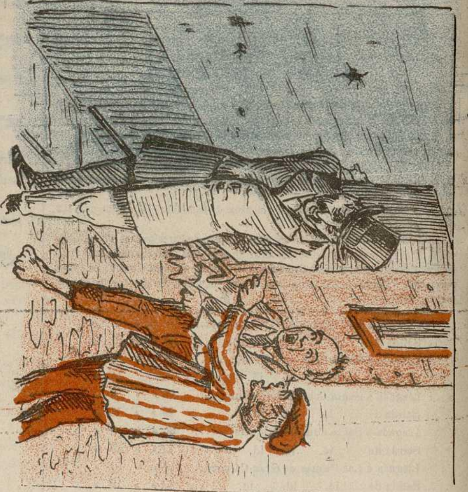
3. Luego ponderan al visitante la profundidad del agujero.