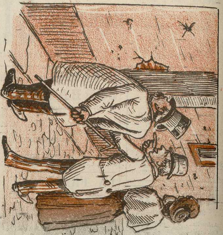
1. En Lavapiés ha sido grande la concurrencia para ver las huellas de las balas.