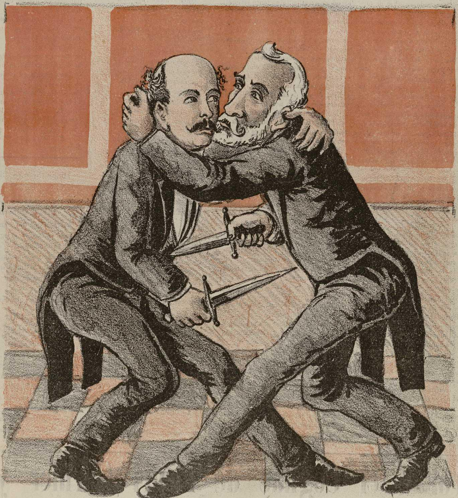
LA UNIÓN CONSERVADORA