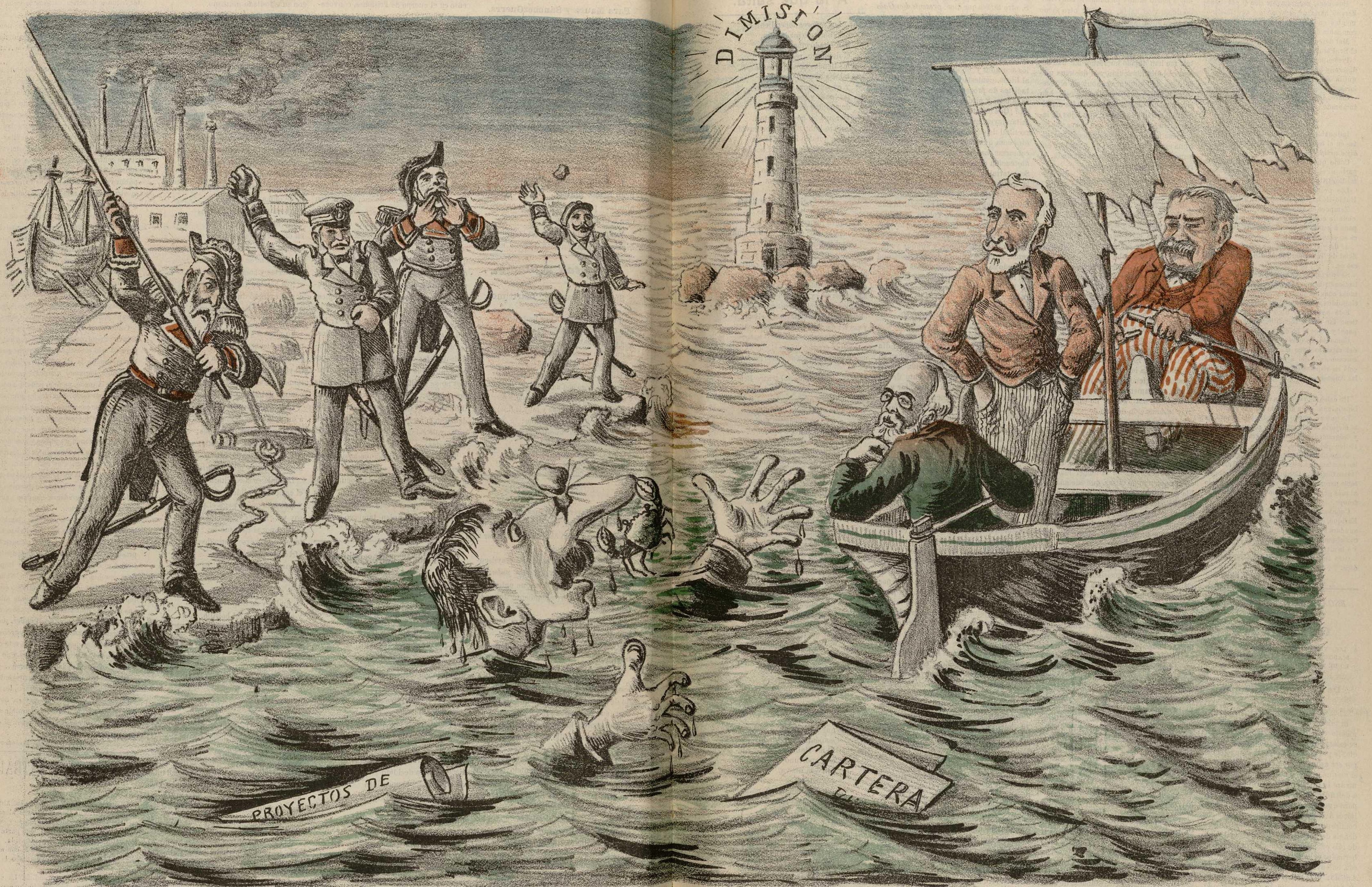
AL PRIMER TAPÓN..... NAUFRAGIO