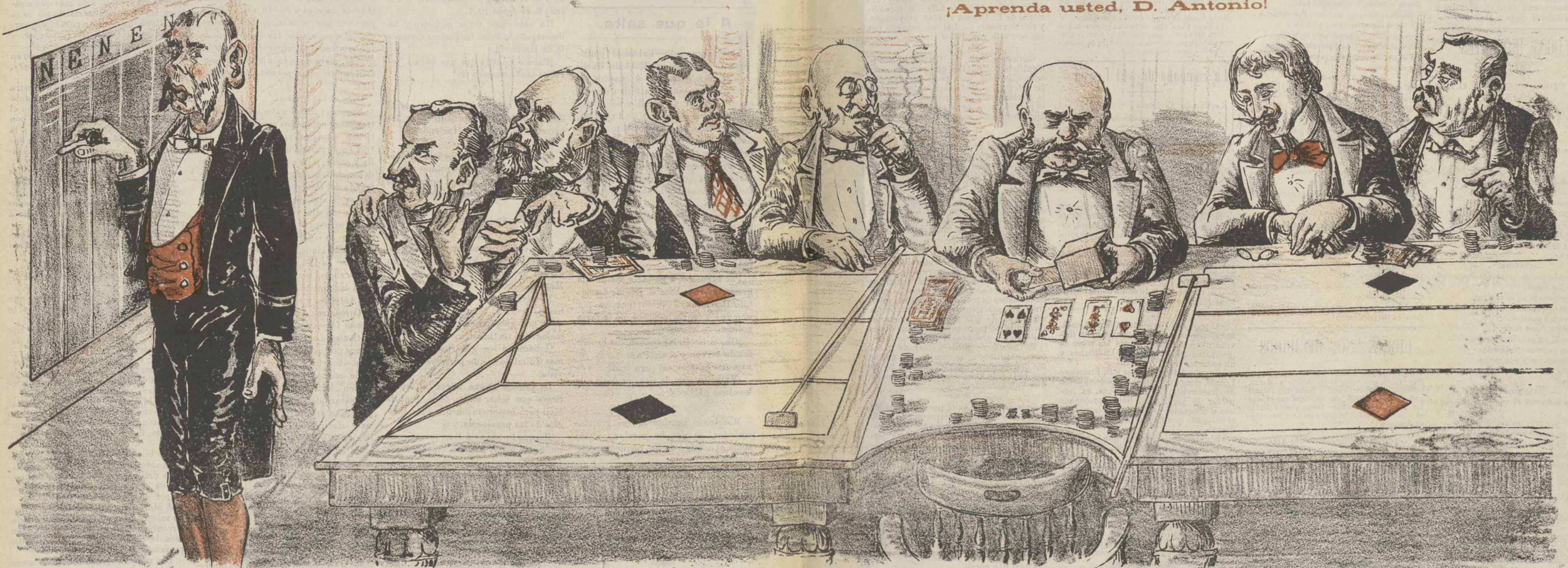
RECREOS del Casino de Madrid