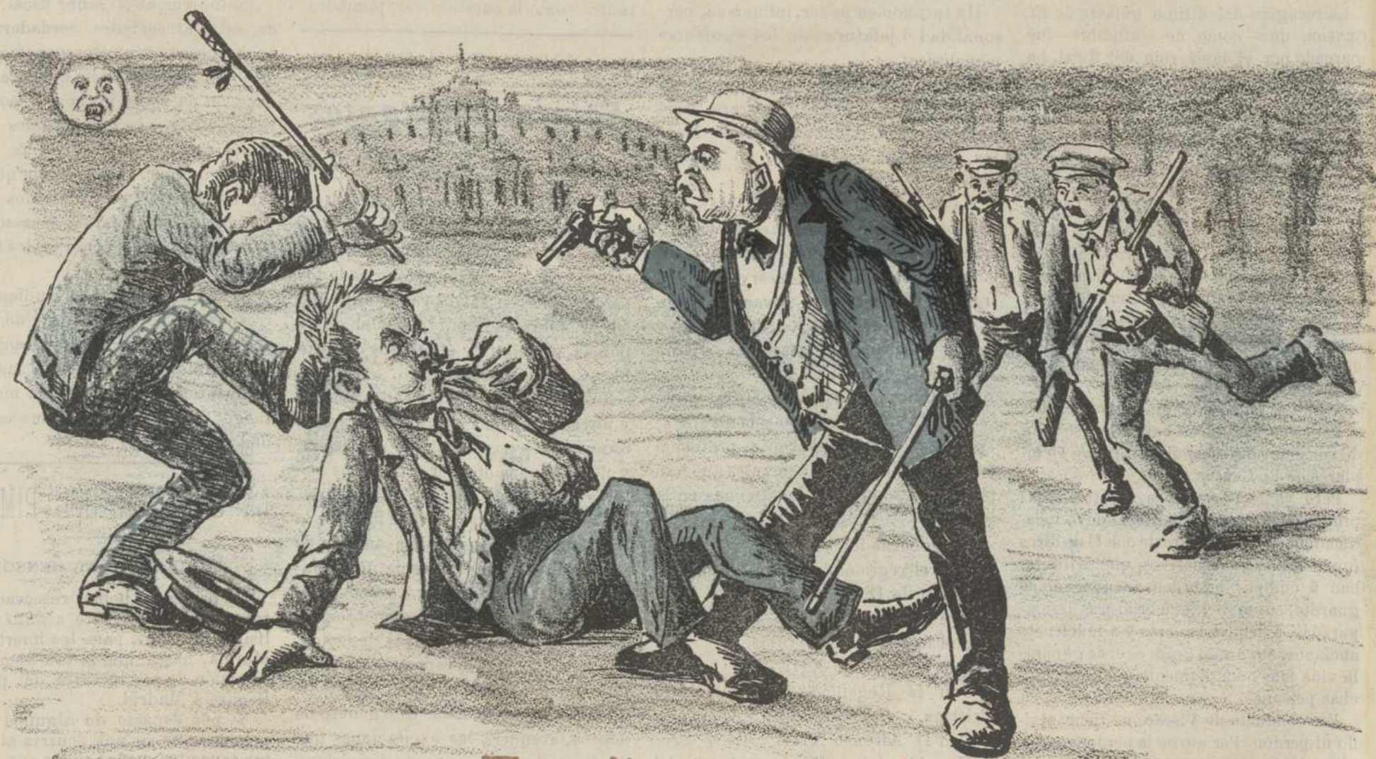
Expedienteo para abrir un garito.