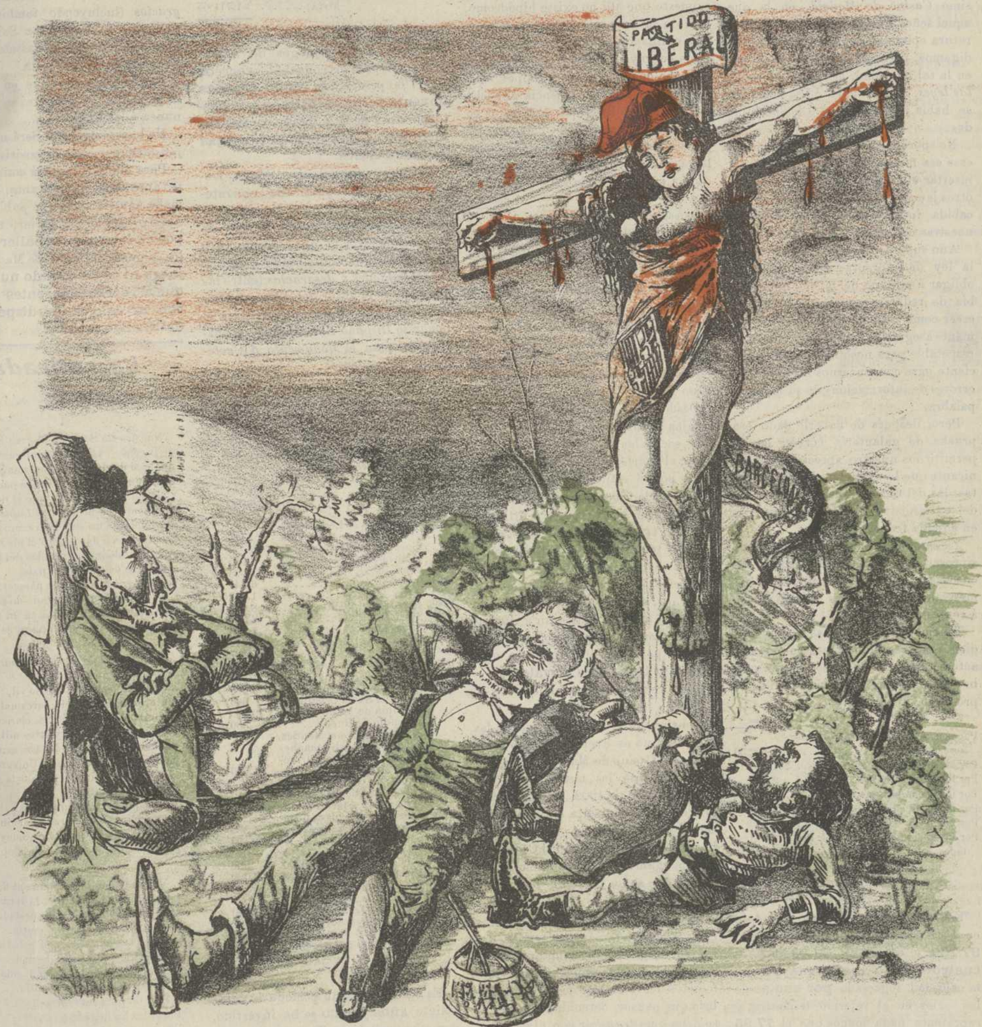
POLÍTICA DEL SIGLO XX