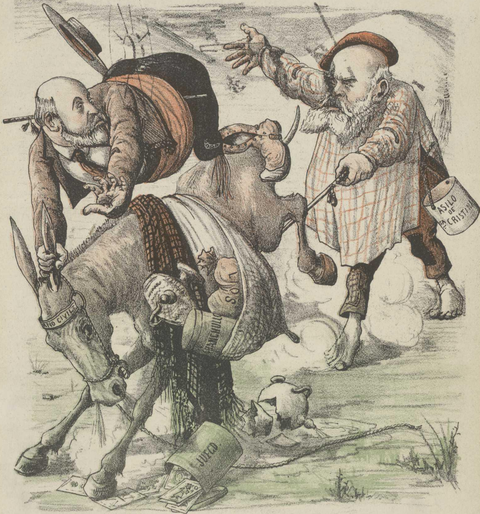
¿Por donde se apeará?