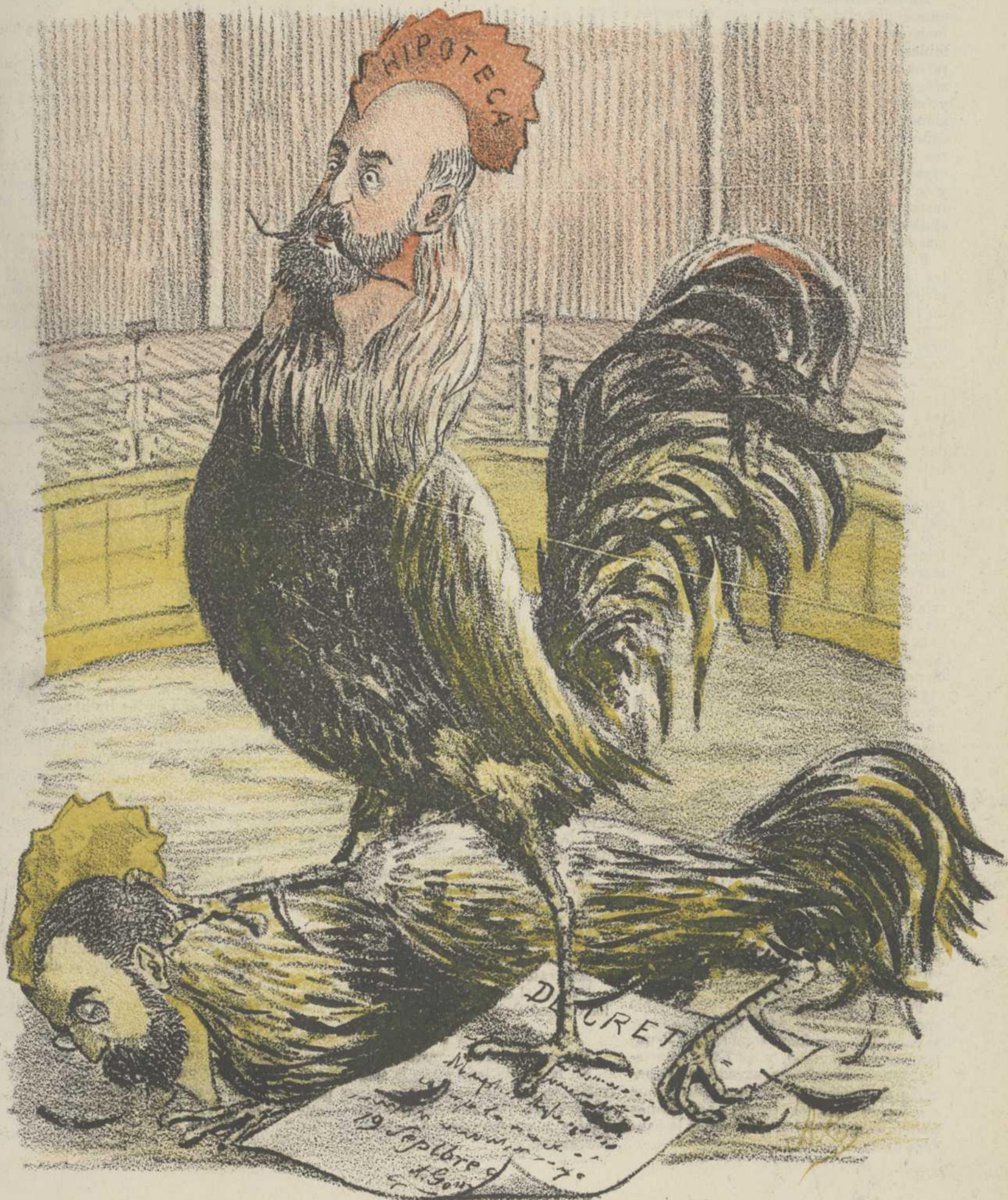
Un gallo que canta la gallina