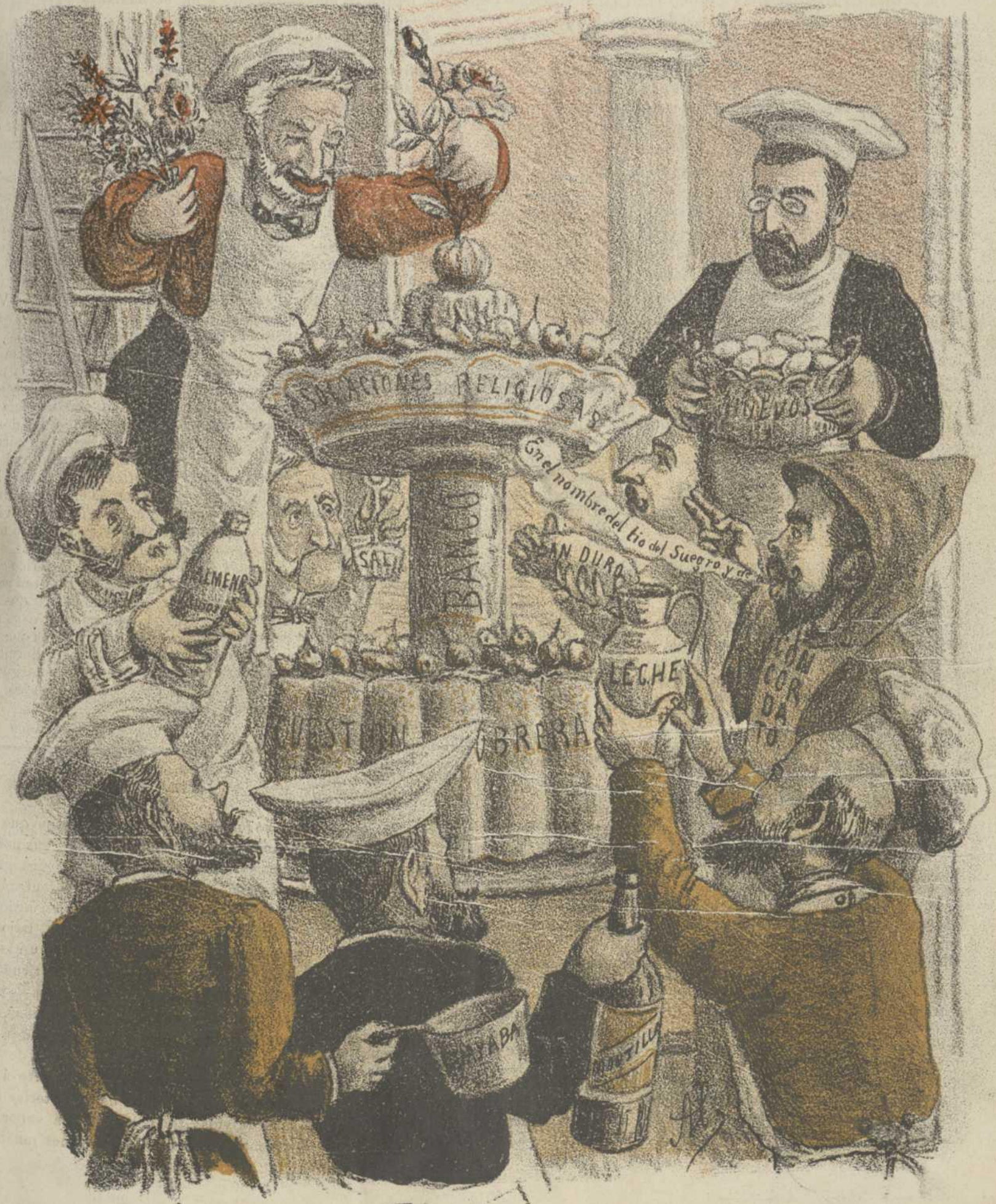
UN PASTEL DE ALTURA