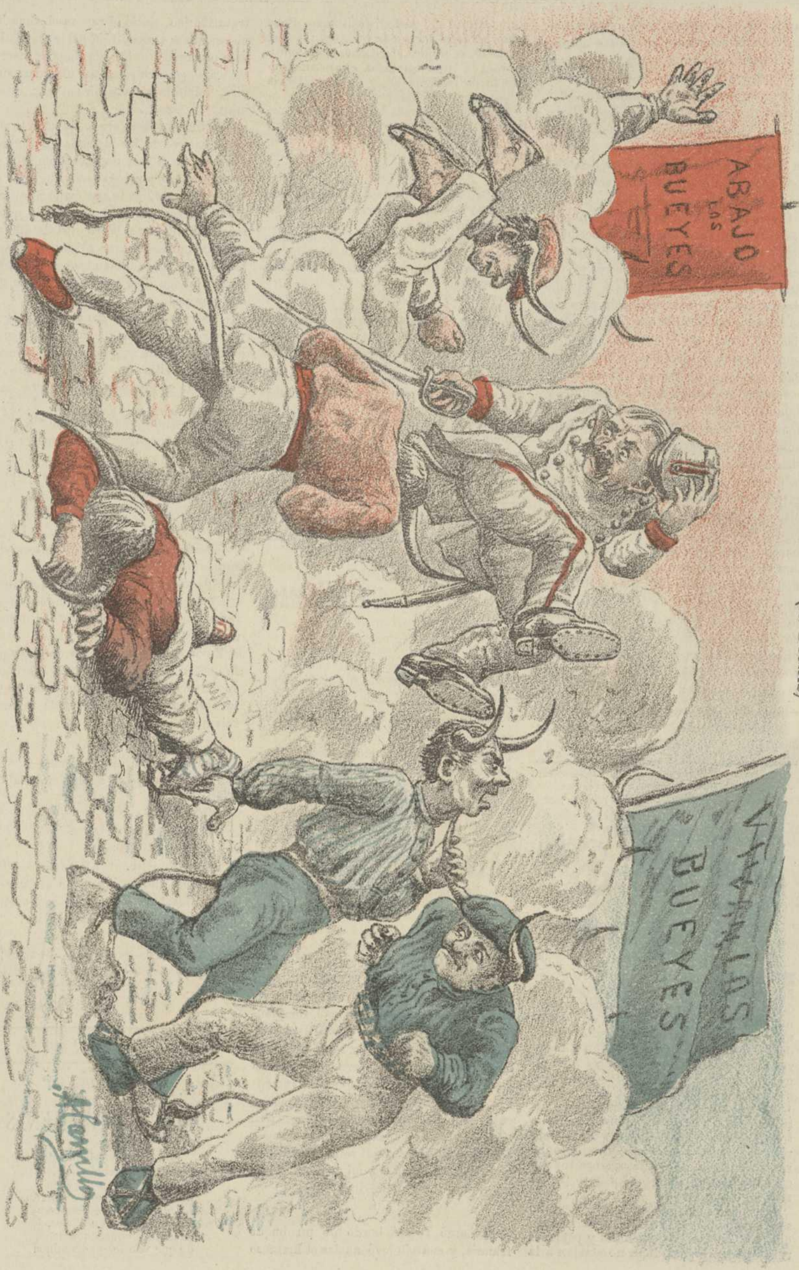
COSTUMBRES DE LA CORTE DE VERANO