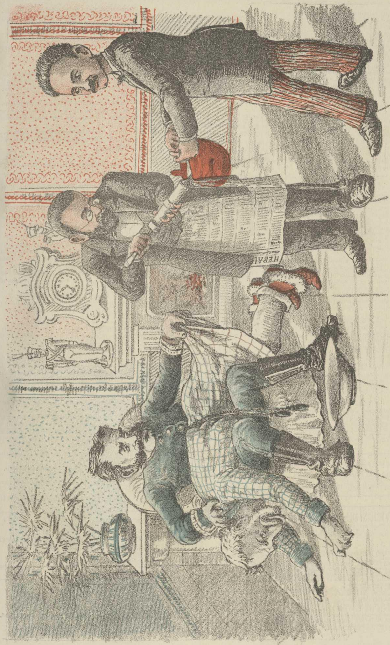
INYECCIONES DE DEMOCRACIA HERÁLDICA