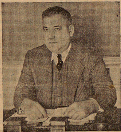
El Conseller d'Agricultura, Josep Calvet, que diumenge recollí tot el sentir i tot el pensar revolucionari i constructiu de la pagesia del Maresme.

posaven en la realització de la nova ordenació agrícola i manifestà la confiança que tenien en el Govern de la Generalitat per tal d'arribar definitivament a la consolidació de tot el que s'anava creant.