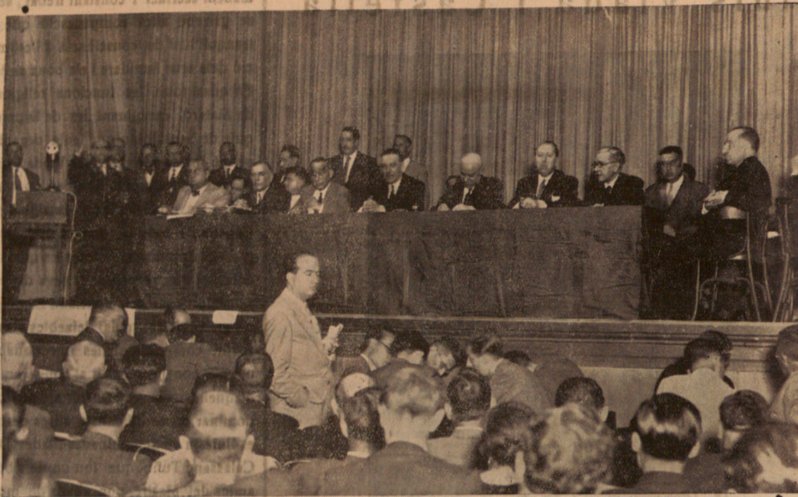
L'Assemblea de l'Institut Agrícola Català de Sant Isidre, a Madrid. Presidència de l'Assemblea entre la qual es troben els senyors Cirera, Martínez de Velasco i Gil Robles.